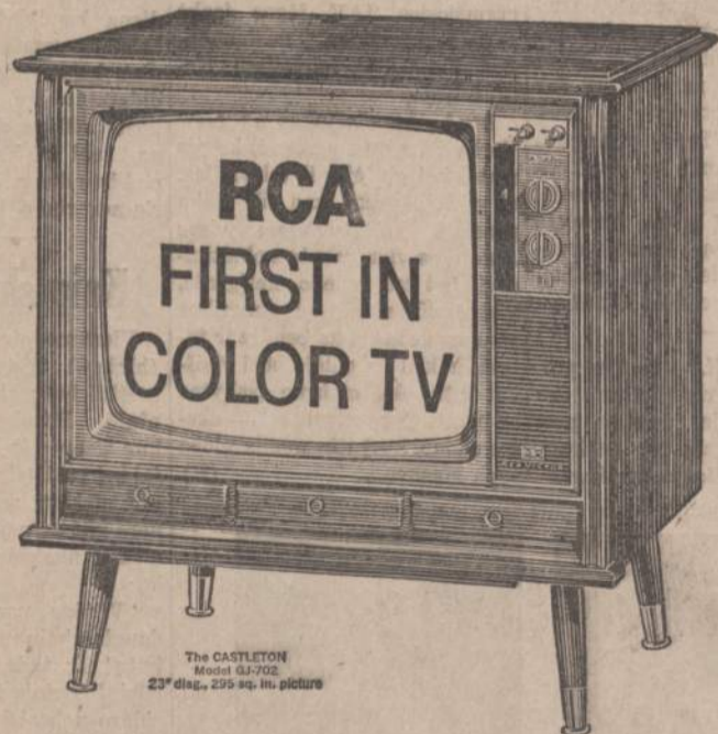
The CASTLETON Model GJ-702 23" diag., 295 sq. in. picture