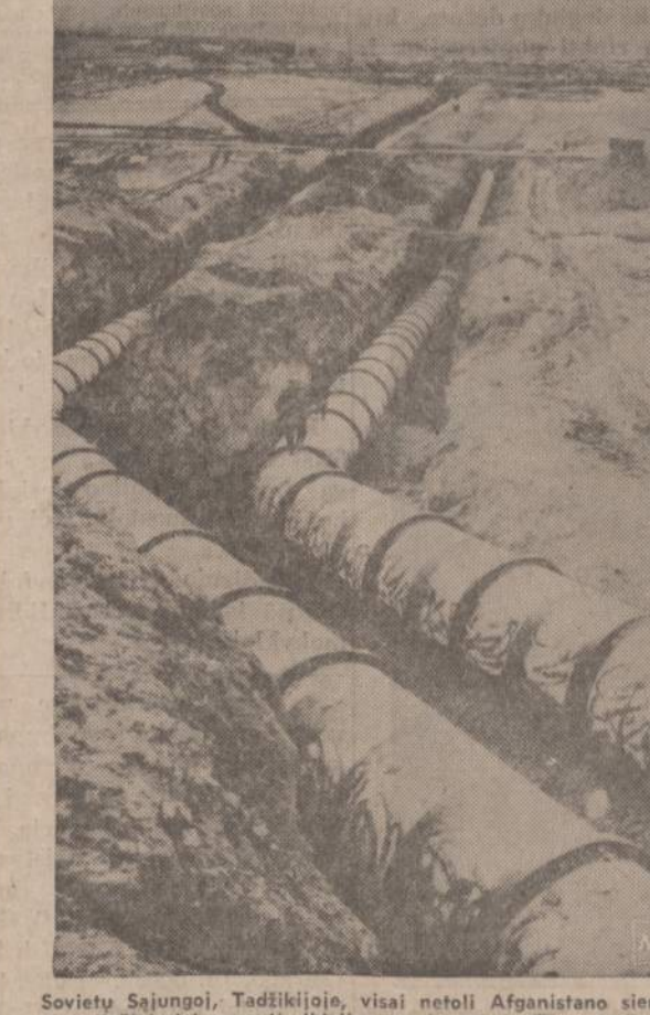
Sovietų Sąjungai, Tadžikijoje, visai netoli Afganistano sienos, sovietų inžinieriai pravedė didelius vandens vamzdžius vandeniu siųsti į saus dirvožemius. Vandens vamzdžiai pravedti upokšnių vagose.