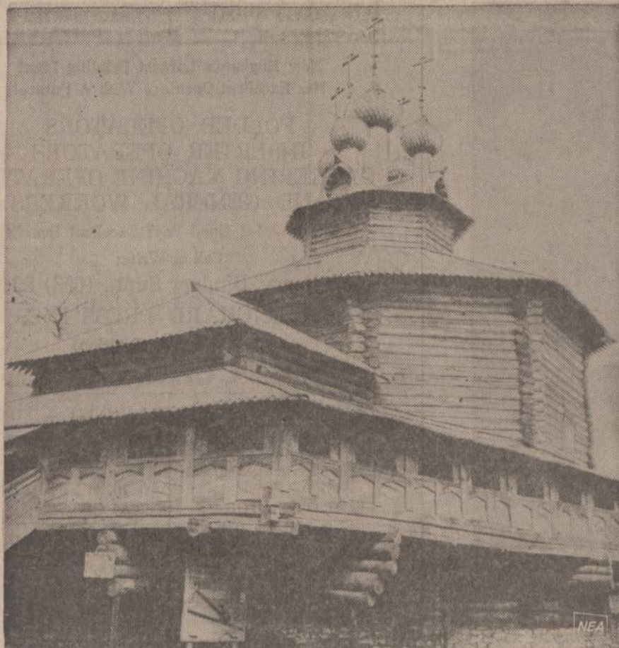
Paveiksle matoma rusiška cerkvė buvo pastatyta 1552 metais. Šešiolikto šimtmečio architektai neturėjo vinių, tikrai kirvius, todėl visoje maldykloje nėra nei vienos vinių. Komunistinė sovietų valdžia nutarė šią rusų maldyklą atnaujinti, kad galėtų parodyti ją turistams.