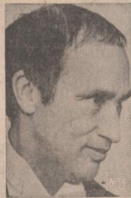
Stipriausių Kanados politinių partijų vadai. Kairėje liberalų partijos vadas Pierre Elliott Trudeau, o dešinėje progresyvių partijos vadas Robert Stanfield. Premjeras Trudeau paleido parlamentą ir paskelbė rinkimus. Dabartinio metu Kanadoje prasidėjo politinė kampanija.

BUENOS AIRES. — Argentinijoje žmonės besiverždami iš stadiono po futbolu rungtynių sutrypę negyvai 71 asmenį, sužeidė dar 93.