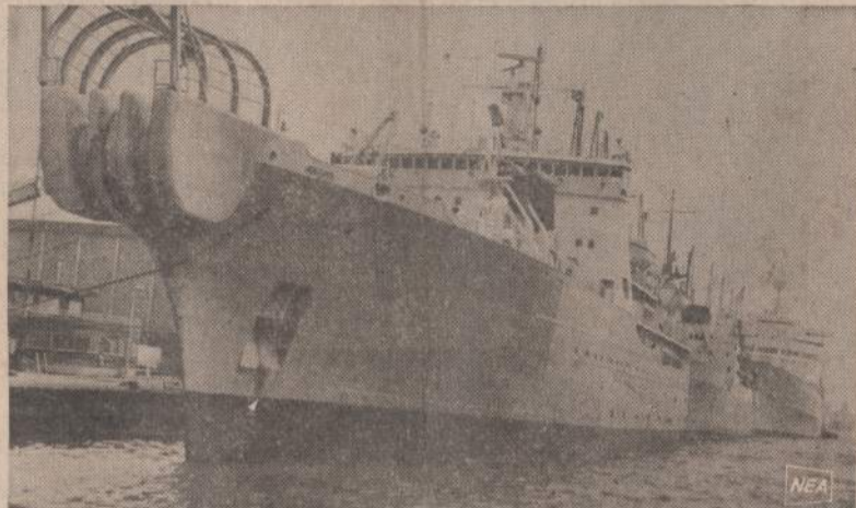
Paveiksle matomas laivas paruoštas povandeninėms telefonų linijoms tiesti. Jis yra paruoštas nutiesti 1,100 mylių ilgio telefono liniją, einančią iš Floridos į Karibų salas. Nutiesta telefono viela vienu ir tuo pačiu metu galės eiti 720 pasikalbėjimų bet kuria kryptimi.

Kinija nuo pat pradžių apie derybas nieko neskelbė ir dabar neskelbia. Tarsi, Kinija žinojo iš anksto, kad tos derybos pasibaigs susitarimu ir atneš į Vietnamą taiką. Kinija puikiai žino apie Siaurės Vietnamo intencijas. Jei ji nieko apie derybas nekalba, tai yra įrodymas, kad tos Siaurės Vietnamo intencijos jai nepatinka ir ji nenori savęs identifikuoti su Hanojaus — Washingtono derybomis. Pekinas žino, kad dabartinė Hanojaus kieta pozicija nėra galutinė ir kad ji keisis.