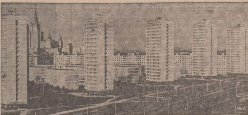
Maskva keičia savo veidą. Vietoje karo metu išgrautų senų namų, rusai dabar pastatė paveikles matomus apartamentinius namus. Naujų mūrų užpakalyje matosi senos Maskvos cerkves.