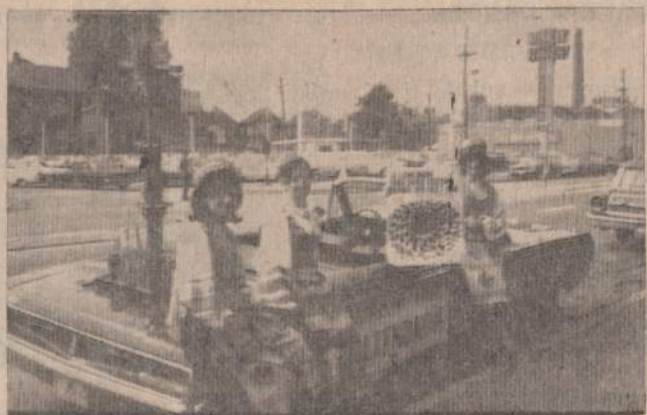
LIETUVAITES GARSINA TAUTINIŲ SOKIŲ SVENTE