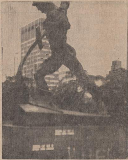
RUSKIAI, LAUK IŠ LIETUVOS, LATVIJOS, ESTIJOS! Sovietų Rusija yra suteikusi Jungtinėms Tautoms "dovaną", kuri 1958 metų Pasaulinėje Parodoje Briuselyje laimėjo "Grand Prix" diplomą. Tai yra dail. Eugenijaus Vuchetio skulptūra, vaizduojanti raumeningą vyrą, kurs atsispirdamas iš kardo gamina žagrei noragą. Ideja ta, kad karo įnagiai būtų paversti taikos ir produkcijos įrankiais. Ta skulptūra yra pastatyta Jungt. Tautų sode prie JT rūmų New York. Praeiti birželio 16 d. pabalsiečiams minint liūdniasias 1940 ir 1941 metų birželio dienas, iš ryto buvo rasti du tos skulptūros piedestale išpėsti užrašai: "Russia get out of Estonia, Latvia and Lithuania" (Rusija, eik lauk iš Estijos, Latvijos, Lietuvos!).