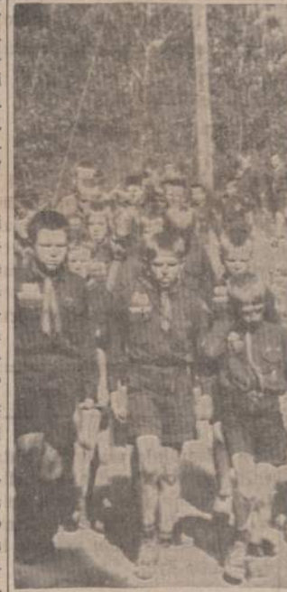
ISEINAME Į ŽYGĮ Ir tuoj pradėsime dainą.

Į šią sueigą visi renkamės punktualiai, tvarkingomis baltomis uniformomis. Būtinai atsiesti daktaro ir tėvų pasirašytus pažymėjimus.