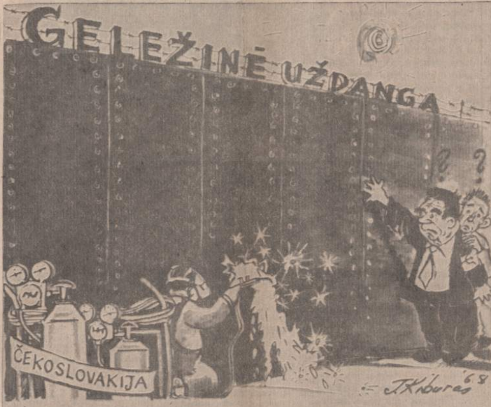
Kremlius vadai Kosyginas ir Brežnevas susirūpinę žiūri: Ar tik, tas Čekoslovakijos Dubčekas nesugadins per tiek metų statytos tvoros?...

KARACI. — Pakistano parlamente gynybos ministeris pareiškė, kad komunistinė Kinija stato Pakistanui ginklų fabriką ir paruošia darbininkus tam fabrikui.