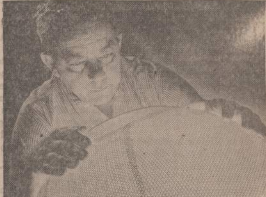
Ant didžiųjų Amerikos bombonešių uodegų yra radaro įtaisai. Jie apdengti paveiksle matomu plastinės medžiagos bokšteliais. Bokštelių apžiūrėja aviacijos technikas.