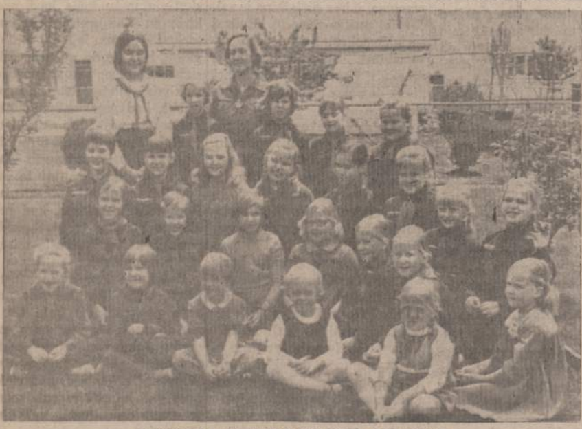
DETROITŲ PAUKŠTYTĖS SU SAVO VADOVĖMIS.