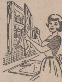
Savo namine vaistų spintelė reikia nepaprastai švariai ir tvarkingai užlaikyti, kaip šiam vaizdelyje parodyta: išimti visas bankutes ir išmėginti lentynas; patikrinti visus užrašus, kad nevyktų klaidų, nes vaistų sumaišymas gali būti fatališkas, patikrinti, kokiu vaistų trūksta ir juos papildyti; kad būtų bet kokiam netikėtumui pasiruošę.

Dabar pas mus Floridoje visos lietuvių organizacijos paima atostogas — tai tinginystės laikotarpis. Aš ir jau išitasis dvi dienas nardžiau po šventojo Petro paplūdimio sūrujį jūros vandenėlių. Onutė