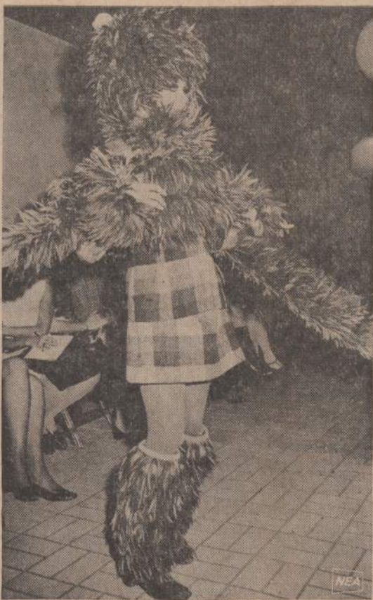
New Yorke vykstancioje moterišku drabužių parodoje pasirodė ir šitoks modelis. Buvo gražas juoko, moterims patiko, bet jos patarė šiam modeliui nebandyti važinėti miesto autobusuais.

Jūs man dėkojote už tai, kad buvau jam gera, bet jūs neturėjote (dėkoti). Jis buvo mano draugas ir šiandien aš būčiau