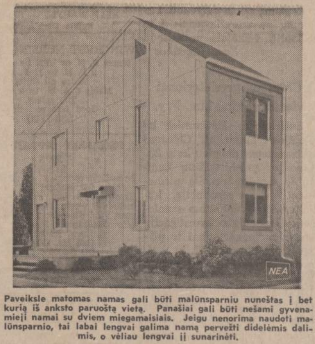
Paveikslė matomas namas gali būti malūnsparniū nuneštas į bet kurį iš anksto paruoštą vietą. Panašiai gali būti nešami gyvena- mieji namai su dviem miegamaisiais. Jeigu nenorima naudoti ma- lūnsparniū, tai labai lengvai galima namą pervežti didelėmis dali- mis, o vėliau lengvai jį sunarinti.

VISOKIUS STOGUS, rinas ir nute- kamuosius vamzdžius sutaisome arba naujus idedame. KAMINUS IŠVALOME ir pataiso- me. Nudažome namus iš lauko ir at- liekame "tuckpointing" darbus. Esame apdrausti, visas darbas garantuotas. Skambinkit LA 1-6047 arba RO 2-8778 [kainavimas veltui, kreipkitės bet kada.