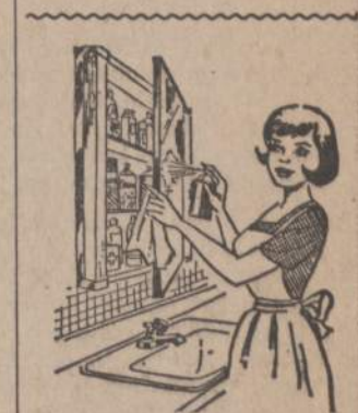
Savo namine vaistų spintelę reikia nepaprastai švariai ir tvarkingai užlaikyti, kaip šiame vaizdelyje parodyta: išimti visas bankutes ir išmazgoti lentynas; patikrinti visus užrašus, kad neįvyktų klaidų, nes vaistų sumaišymas gali būti fatališkas, patikrinti, kokiu vaistų trūksta ir juos papildyti kad būtum bet kokiam netikėtumui pasiruošęs.

ma); jie nebeprivalės nešioti žvakides, bet taip pat pašalinama pagalvėlė atsiklaupiant po kelių padėti. Visose liturgijos dalyse vyskupas beturės vartoti vieną mitrą, o nebe kelias skirtingas mitras įvairioms pamaldų dalims.