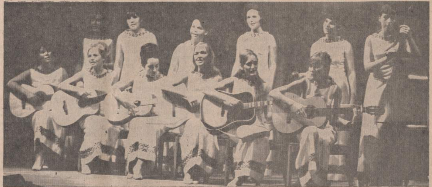
AIDUČIŲ CHORAS DAINUOS SLA BANKETE

Susivienijimui teko pergyventi ir daugiau įvairių krizių, kuomet valstijų apdraudos departamentai priverstė mokėti duoklę pagal amžių ir tiems, kurie buvo įstoje į susivienijimą prieš 1911 m. Skaudė krizė išliko 1918 ir 1919 metais, kuomet ty pačių įstaigų reikalavimu prisidėjo apdėti narius nepaprastomis duoklėmis, kad atgautų siautuosios epidemijos — influencos padarytus organizacijai nuostolius, nes išmirė nepaprastai didelis skaičius narių. 1920 m. ir vėl susivienijimas turėjo daug ginčų ir nesusipratimų. Komunistai norėjo pagrobti susivienijimo vadovybę. Ši kova atsirado dėl to, kad komunistinės SLA narių grupės žygius rėmė komunistų partija. 1930 m. SLA 36-to seimo metu neįsileidus komunistinės delegatų grupės atstovo į mandatų komisiją, komunistai kėlė didžiausią triukšmą. Pagaliau su policijos pagalba buvo atstatyta seimo posėdžio tvarka. Seimo salę aplėdžio delegatų, kurie posėdžiavo skyriumi ir nutarė teismo keliu išskirti savo nutarimams pripaži-