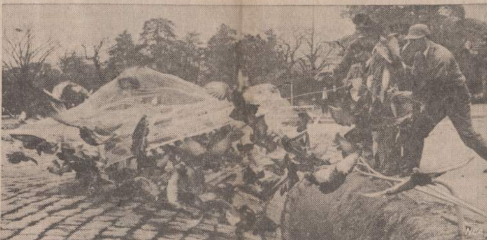
Tokijoje parkuose tiek priviso karvelių, kad miesto valdyba įsakė juos gaudyti ir gabenti į kitas vietas. Specialiais tinklais vienu užgriebimu pagauinama apie 200 karvelių.

Neiškentęs įsikio senatorius (Pabaiga 5 psl.)