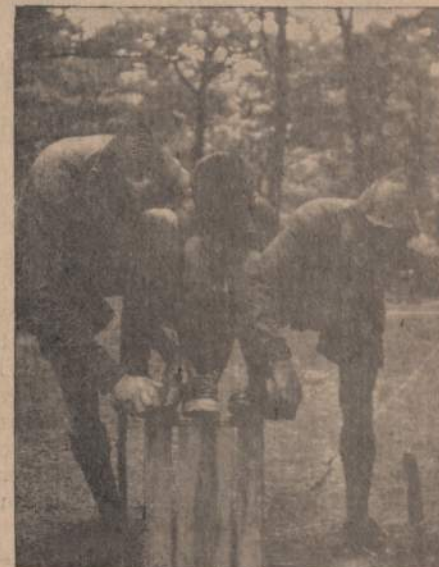
TAUTINEI STOVYKLAI BESITVARKYDAMI, apžiūrime kiekvieną uniformos siūlelį ir batų.

ko prausyklos, tiesiasi vandentiekio vamzdžiai, ir per veidus bėga prakaitas. Už kelių dienų tūkstantiniais skaičiais čia suvažiuos mūsų skautiškas jaunimas, ir 5-tos Tautinės Stovyklos daina sudrebins Rako mišką. Stovyklos ežero plačioje pakrantėje rikiuos ir lenktyniuos jūrų skautų burlaiviai ir