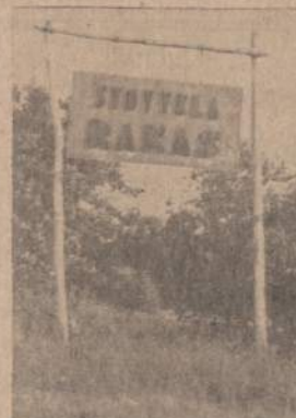
VIENA IS SONINIŲ LENTŲ