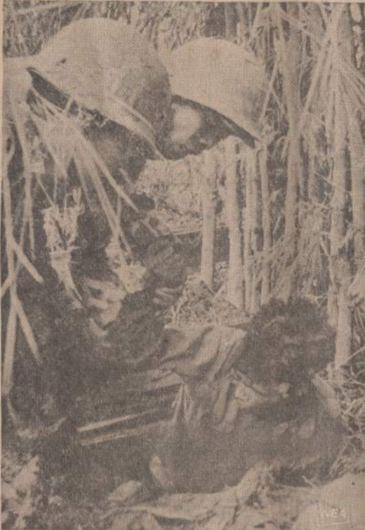
Du Pietų Vietnamo kareiviai ištraukia iš slėptuvės Viet Congo kareivį. Šie dažnai kovoją pasislėpę, vadinamos, "voro skylėse". Jos iškasamos po namais, šiukšlėse ar net kapinėse.

Britanija. Galutinis rinkos valstybių tikslas turėtų būti Europos kontinento suvienijimas.