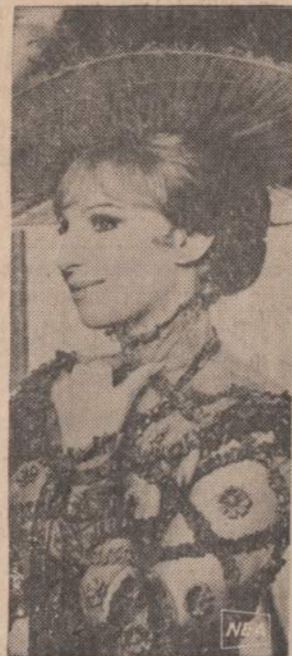
Dainininkė Barbara Streisand, pasi-puolusi plunksnuta skrybėle ir kostiumu naujam savo filmui "Hello, Dolly!"