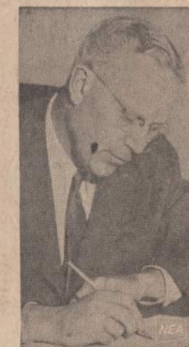
Buvęs Kalifornijos gubernatorius Earl Warren 1944 metais.

Kardinolas pabrėžė reikalą religijai ir mokslininkams artimiau bendradarbiauti, nes pasaulis yra valdomas bankininkų, generolų ir profesionalų politikų. Dabar, kaip ir anksčiau, žmonių inteligencija valdo mirtį nesąnčius arsenalus. Mokslininkai turėtų turėti didesnę balsą pasaulio valdyme. O su jais kartu dirbti turėtų ir teologai, — pabrėžė kardinolas.