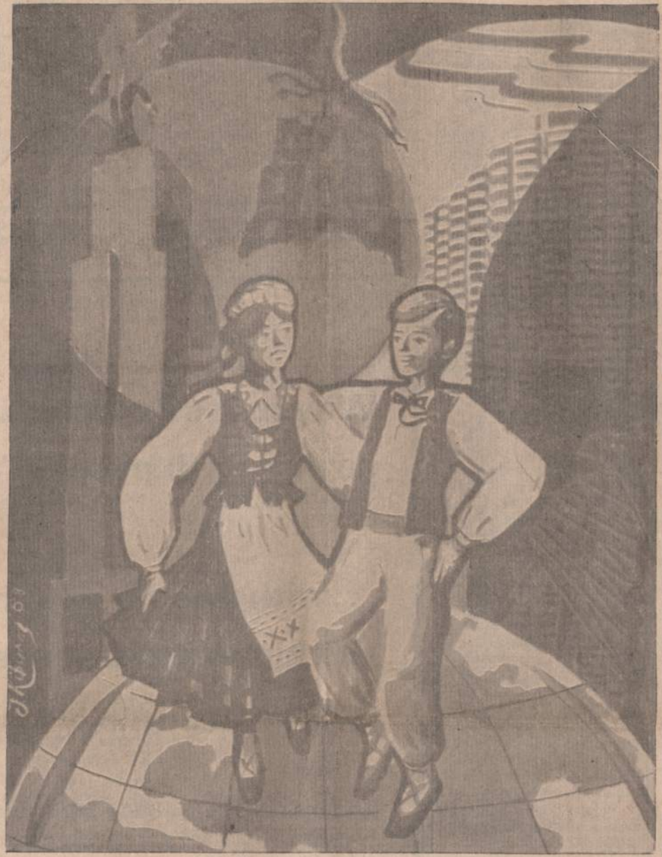
Sveikiname III-sios Tautinių Šokių šventės dalyvius, suvažiuojančius į Čikagą

Visoje Sovietų Sąjungoje, partijos vadai organizuoja šimtų mitingų, kurių vienintelis tikslas yra padaryti įtaką naujai čekų valdžiai ir įspėti ją, kad ji neitų per toli. Net ir okupuotoje Lietuvoje laikraščiai pil-