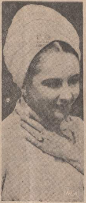
Filmu artistė Elizabeth Taylor taip laiko savo ranką, kad fotografai galėtų nufotografuoti retą deimantą žiedą, kuri jį neseniai gavo dovanų iš savo vyro Richardo Burtono. Žiedas turi 33 karatų deimantą akį.