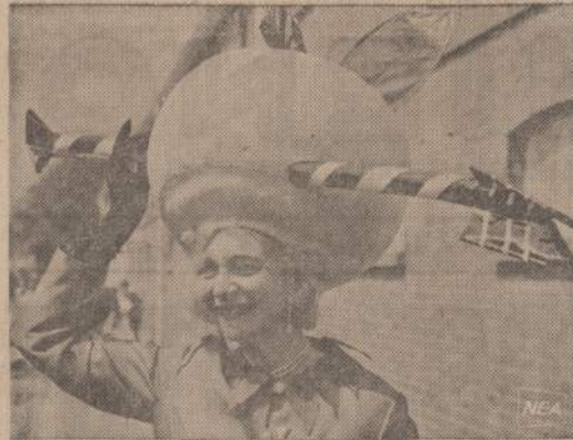
Karališkose britų arklų lenktynėse Askote visada susirenka moderniai pasirengusių ponų. Čia matoma skrybėlė — lyg strėlė peršautas arbūzas — šių metų sezono atkreipė daugiausia dėmesio.

"Vyresnio amžiaus žmonės gerai atsimena, kad, atėję Vokietijoje į valdžią, hitlerininkai ilgainiai nebeslėpė savo agresy-