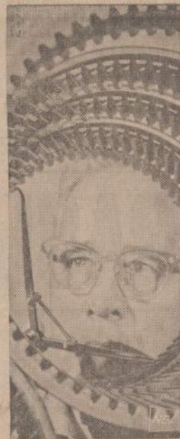
Mechanikas tikrina modernių laivų krumpliarčius, kurie leidžia kapitonui laivą iš priekinio bėgio perjungti į užpakalinį, visai neličiant neutralaus.

B. Maceika (Bus daugiau) REMKITE TUOS BIZNIERIUS. KURIE GARSINASI "NAUJIESE"