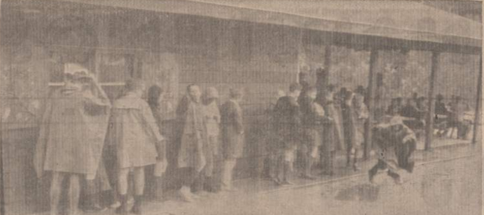
STOVYKLOJE KARTAIS IR LIETUS APLANKO Pietų laikas Rako stovyklavietės Kaziuko Seklyčios valgykloje.