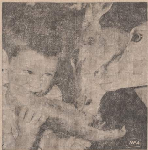
Dabartiniu metu pietinėse valstijose jau pradėjo nokti arbūzai. Vienas jaunuolis, gerokai arbūzo užvalges, vaišina savo draugus.

Šakių Apskritis Klubas valdyba ir Parengimų komisija jau yra smulkiai išdirbusi planus surengimui metinio pobūvio — vakarienos, kuri įvyks lapkričio 16 d. Lietuvių Vyčių salėje, 2455 W., 47th Street, Chicagoje. Netrukus bus planinami pakvietimai šion vakarieniems, kurie tekainuos tik po 3 dolerius, už kuriuos bus duodama vakarienė su miokštais ir stipriais gėrimais. Čia įskaitomas įėjimo mokestis į vėliavą vyksimą pasilinksminimą. Vakarienės metu bus pageidūti ar atžymėti labiausiai klubo veikloje pasidarbę asmenys. Tą dieną klubui sukaks ir 31-ri veiklos metai. Taigi, visi žaunavikai ir visi mūsų bičiuliai