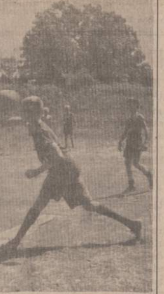
AKIMIRKA IŠ ZAIDYNIŲ Rako ažuolyne

Iki malonaus pasimatymo taip laukiamoje stovykloje.