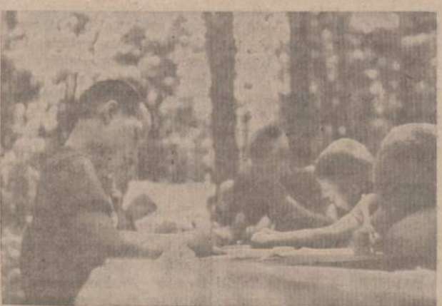
UZDAVINYS PO AŽUOLU Aprašyti naktinę iškvilę

Rako stovyklavietėje, kur dabar vyksta Penktoji Tautinė Stovykla, kiekvieną vasarą stovyklauja Chicago skautai ir skautės. Liet. Skautų-S-gos vadovybė iš visos eilės siūlymų šią stovyklavietę pasirinkus penkiasdešimtmečiui atžymėti, atsirado eilė stambių uždavinių jau nuo pernai rudens, norint paruošti visas sąlygas ne tik didelio skaičiaus stovyklautojų malonumui ir džiaugsmui, bet ir atitikti smulkmeniškai nustatytus valdžios reikalavimus