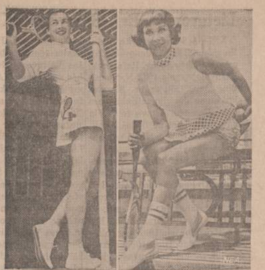
Teniso žaidėja 1951 metais daugelį nustebino, kai ji išėjo žaisti trumpa suknele (kairė). Ji žaidė ir šiais metais, bet jos aprėdais jau buvo truputį kitoks.

„Draugo“ vedamas, pasirašytas J. Pr. vakar rašo: „Ši trečioji šokių šventė suorganizuota JAV Lietuvių bendruomenės iniciatyva ir visi turime reikšti padėką bendruomenei ir jos vado-