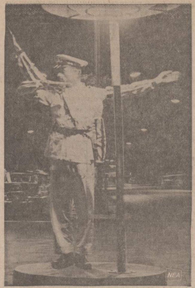
Fotografai pavyko taip dviem negatyvais nufotografuoti šį Kairo, Egipte policininką, tvarkančį gatvės eismą, jog atrodo, kad jis tu-ri tris rankas.

Vietiniam gyventojams šis pavasaris nebuvo palankus, nes buvusios gegužyje šalnos labai pakenkė sodų derliams. Birželio pradžia buvo labai sausas, bet paskutiniai jo sa- vaitė savo lietus duosnumu ir audra beveik rekordinė. Ta- čiau atžygiavusios vasaros gro- žis visus tuos buvusius nema- lumumus toli gražu pralenkia. J. J-tis