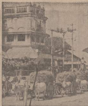
Burmoje nėra vakaruose taip įprasto automobilių susigrūdimas. Gatvėse, kaip paveikslas rodo, vyrauja kitokios susisiekimo priemonės.

GYDYTOJAS IR CHIRURGAS Bendra praktika, spec. MOTERŲ LIGOS Ofisas: 2652 WEST 59th STREET Tel.: PR 8-1223 OFISO VAL.: pirmad., antrad., trečiad., ir penkt. 2-4 ir 6-8 val. vak. Šeštadien- iais 2-4 val. po pietų ir kitu laiku pagal susitarimą.