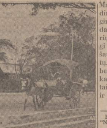
Burmoje nėra vakaruose taip įprasto automobilių susigrūdimas. Gatvėse, kaip paveikslas rodo, vyrauja kitokios susisiekimo priemonės.