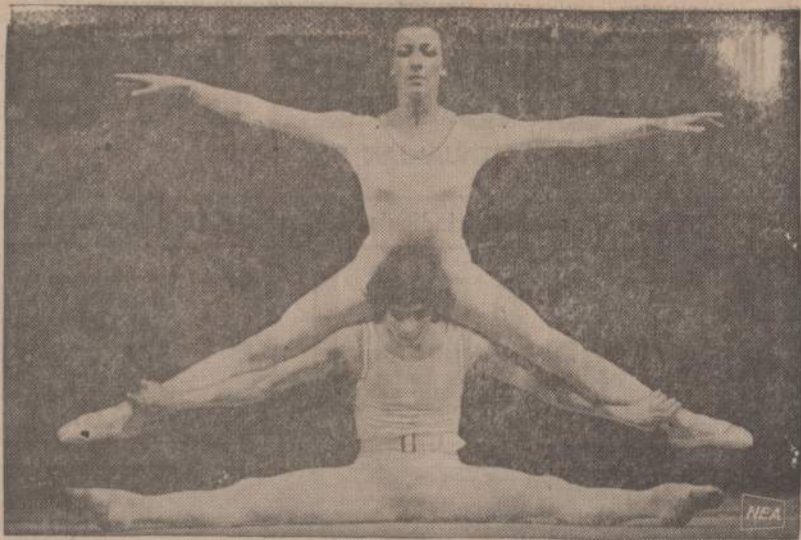
Paryžiaus operos šokėjai naujame "Turangalia" baletu sustinge gyvame paveiksle. Vienas jų yra vyras, tik sunku atspėti — kuris.