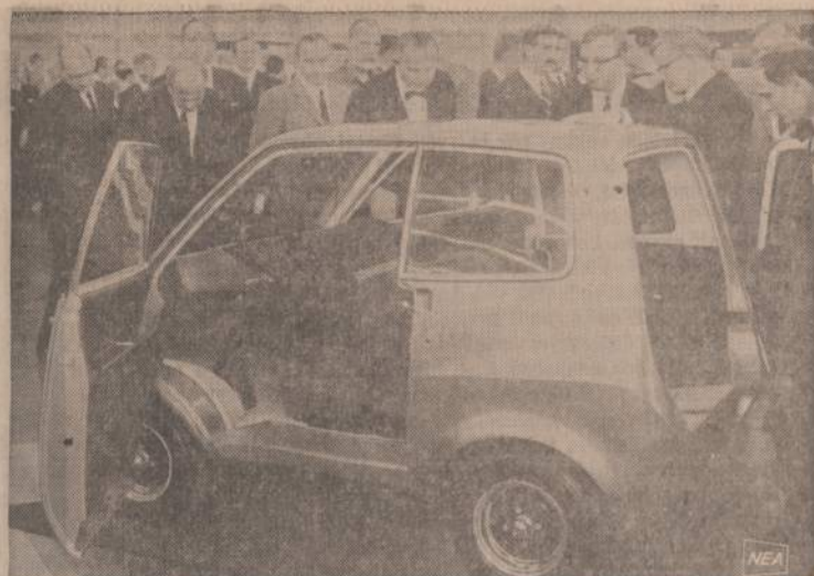
Naujausias vokiečių pigus automobilis, demonstruojamas Koelno gatvėse. Automobilis tinka tiktaiv duim keleiviams, bet jis turi trejas duris. Galima jį sudėti prekes ir lagaminą. Didelė šio pigaus automobilio gamyba bus pradėta rudenį.

Po šios prakalbos lietuviai dar labiau nūrio ir lankė tarp Sovietų Sąjungos ir Vokietijos karo, kuris atrodo neišvengiamas ir kuris neabejotinai turėjo atnešti Lietuvai laisvę, kaip 1918 metais. Kol tas virst tikrove, viltį teikė gandai apie aktyvių pagrindžio veiklą kontakte su Vokietijoje dirbančiais lietuviais. Išitikinimai kaip miestuose, taip ir kaimuose, slapta buvo klausomasi radijo pranešimų iš Vakarų Europos miestų, nežūrint bolševikų griežto draudimo. Bet to niekas nepaisė, juo labiau, kad ir miglotos žinios vis dėlto ro-dė, kad karas tarp Hitlerio ir Stalino yra neišvengiamas. Pirmą kartą tautų istori-