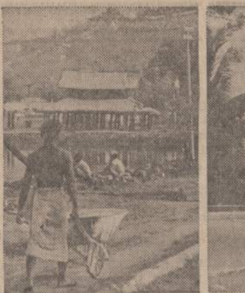
Burmoje nėra vakaruose taip įprasto automobilių susigrūdimas. Gatvėse, kaip paveikslas rodo, vyrauja kitokios susisiekimo priemonės.