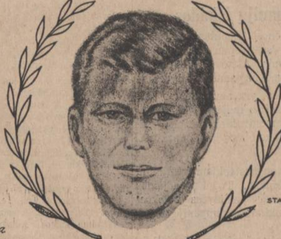
John F. Kennedy Thirty-Fifth President UNITED STATES OF AMERICA

WORLD PREMIER LIMITED EDITION Dedicated to