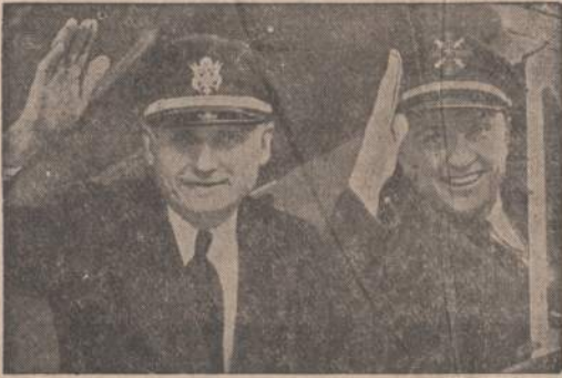
Sekmadienį, liepos 14 d., bus pagerbti lietuviai lakūnai Darius ir Girėnas.

Savo kalboje pirmame priėmime Kosyginas puolė Izraelį, kuris trukdąs pasiekti Viduriniųjų Rytų taiką. Spėjama, kad Kosyginas ragins švedų vyriausybę pripažinti Rytinę Vokietiją.