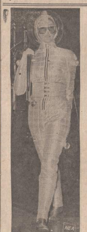
Specialistai tvirtina, kad už 32 metų pačiužininkai davė šiam paveiksle matoma drabuži. Jis rodo kiekvienos kūno dalies temperatūrą. Tvirtinama, kad jis labai patogus sportuoti.