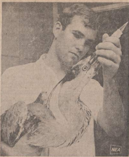
St. Petersburg, Fla., zoologijos sodo prūdan nusileido paveiksle matomas garnys ir nepajėgė pakilti. Veterinorius tuojau išaiškino, kad šis garnys buvo išvėjęs į ilga meškerę, supančiusia jo sparnus. Meškerės gale esantis plieninis kriukelis buvo garnio gerklėje. Veterinoriui teko daug dirbti, kol kriukelį ištraukė.