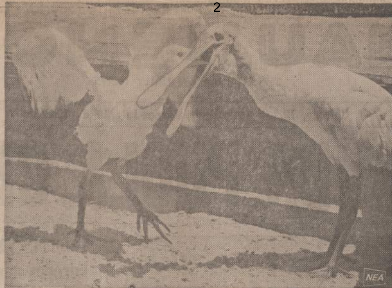
Saukštėnapiš garmys poni savo vaiką iš gurklio. Garmys prisiriša varlių ir žuvelių, o vėliau prasioja, kad naujai išsiritęs garmukas galėtų jį iš gurklio išitraukti. Pavoiksle matome 4 savaičių jaunikį, besirenkantį maistą iš motinis gurklio. Pavoiksle nutrauktas Floridos paukštyne.

Savižudystė ir žmogžudystė visų, ypač krikščionių yra pamerkti elgesiai. Aiškiausiai medicina nurodo cigaretės žalą plaučių vėžio atsiradime. Čia nėra jokio neaiškumo. Sunkenybė