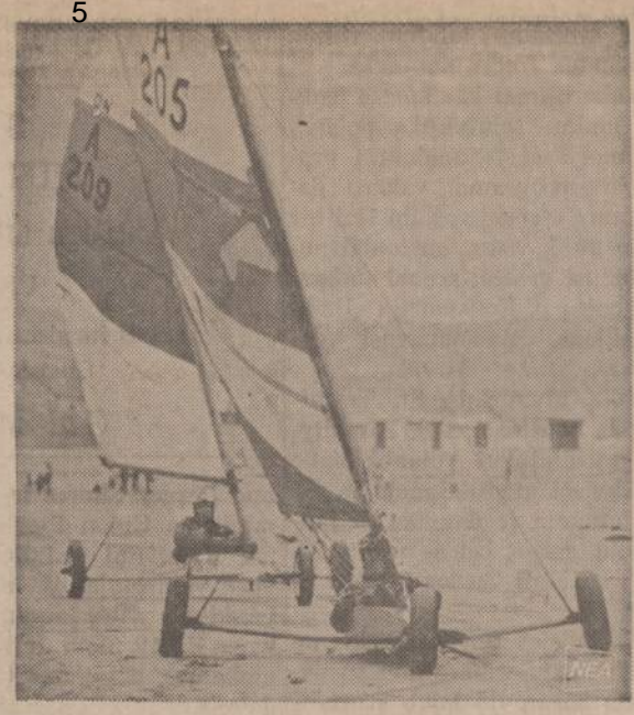
Iki šio mėto sportininkai lenktynėms naudodavo burinius laivelius, bet dabar madon jau įeina buriniai ratukai. Pavėkslas trauktas An- glijoje, Ferranparth sporto aikštėje. Panašiai pradeda sportuoti ir kituose kraštuose.

BALZEKAS MOTOR SALES "U WILL LIKE US" CHRYSLER • IMPERIAL PLYMOUTH • VALIANT 4080 Archer VI7-1515