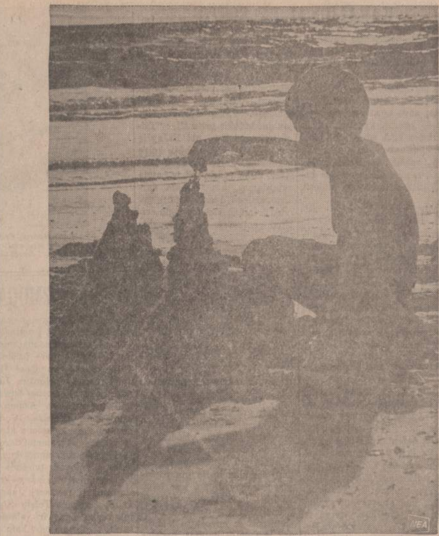
St. Petersburg, Fla., pakraštyje berniukas, saulei besileidžiant, tėtis pasakų piliis. Jam patinka ne tik pati piliis, bet ir meniški jos šešėliai.

Žymiai vėliau Bažnyčios susirinkimuos pasisakoma už specialų lopą ant žydo nugaros. Bet popiežius Inocentas III išleido specialią bulę, kurioje tai klero darbas. Jei nebuvo