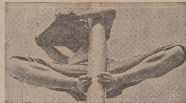
Floridoje, Monroe Station srityje kiekvieną mėną suvažiuoja jaunimas savo šventei. Šventės metu jie rodo savo galią ir išmone. Šis jaunuolis bando lipi riebaluotu stulpui. Tai ne toks lengvas dalykas. Gerokai palipėjęs, jis bando marikiniais nušluostyti riebalus, kad galėtų slaugyti aukštyrą.

Jos buvo valdomos Chicagos Kat. Vyskupo nurodymais ir autoritetu. Ir visos kitos naujos vyskupijos kapinės kada jos buvo pradamos organizuoti, nežūrnt jų geografinės padėties ar steigėjų tautybės, taip pat buvo organizuojamos, to laiko, vyskupo autoritetu. Atsižvelgiant laiko aplinkybių kapinių priežiūra (supervision) įvairiais skirtingais būdais, skirdavo vyskupas. Kai kurios kapinės būdavo valdomos vieno žmogaus pasauliečio kuris duodavo apskaitą tiesioginiai vyskupui. Kitos — buvo valdomos klebonų valdybos kuri darydavo pranešimus vyskupui. Dar kitos būdavo administruojamos tam tikros organizacijos (specific institution) duodančios apskaitą vys-