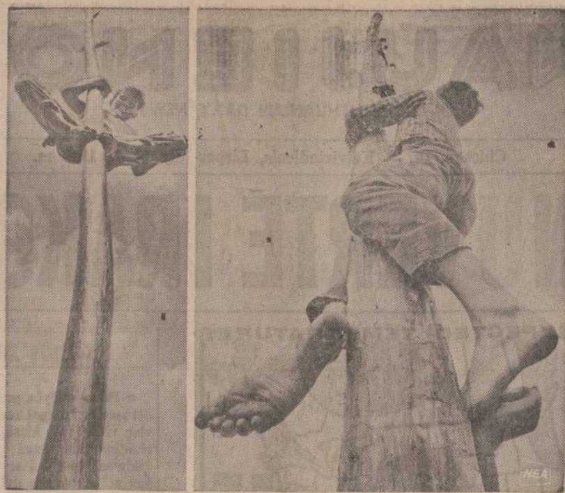
Stulpo viršūnėje yra prikaltas popierinis puodelis. Kas nusilms puodelį, tas bus paskelbtas geriausiu sluožeju riebaločiu stulpo. Vienas, pusę kelio padaręs, išsis. Antras tikrai pradeda, bet jam sunkiai einasi. Jeigu tėvas nepadėtų, tai jis nučiuožyt žemyn. Floridoje, Monroe Sta-tion srityje suvažiavęs jaunimas kiekvieną mėną sportuoja.