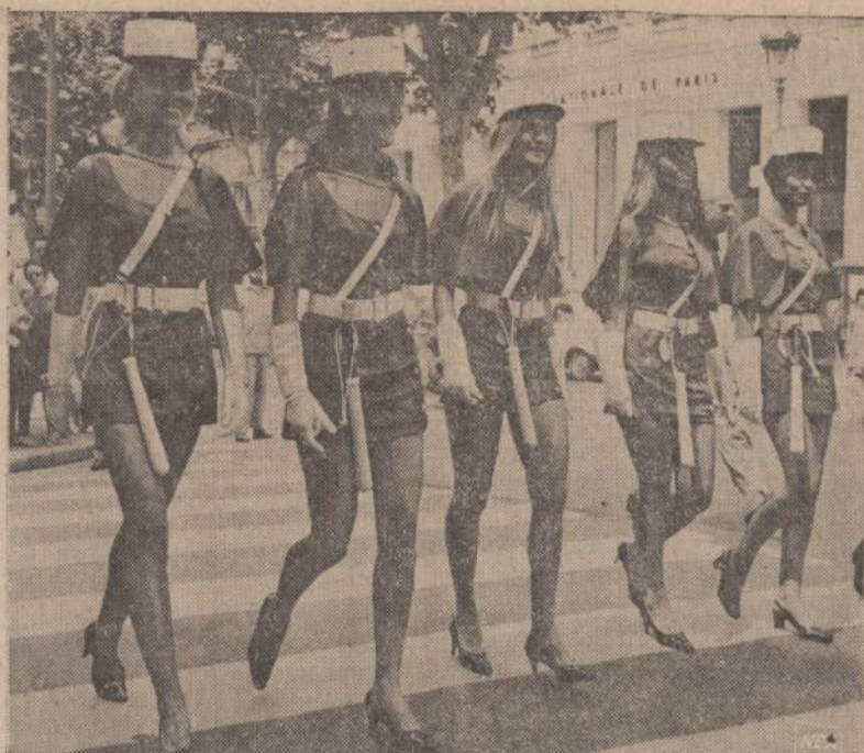
Prancūzijoje, Nicos kurorte gatvėje pasirodė šie "policininkai". Tos merginos tik garsino ar- chitektų sąjungos ruošiamą balių.

Kalbamasis traukinėlis, šio- kiadieniai važinėjęs dviem va- gonais, šventadieniai po keturis vagonus, yra vienintelė "rezorti- nė" priemonė automobiliu netu- rinčiam pasiekti Michigano pa- ežerės "byčius". Įsivaizduokite žmogų su žmona ir tuzinu vaikų.