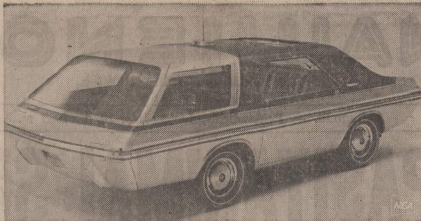
U. S. Steel bendrovė, norėdama parodyti, kad iš plieno galima, ką nori pagaminti, demonstruoja šį taxi automobilį, siūlydama automobilių fabrikams panašius gaminti masiniam varfojimui. Automatinis vardas — "Inovari II"

— In being an American does not imply that you can not be a Lithuanian. You can be an American and a Lithuanian. Your parents were Lithuanians... Why don't you want to be a Lithuanian?... You have Lithuanian blood... You started the trouble when you took away the rights of Lithuanian lot owners... — You don't own anything,