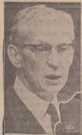
Maurice Couve de Murville, naujai paskirtas Prancūzijos premjeras. Dešimt metų jis buvo Prancūzijos užsienio ministeris, paskutinius du mėnesius buvo finansų ministeris, o praėjus savaitę prezidentas Charles de Gaulle paskyrė jį premjeru.

Moteris pėsčia, aš dviračiu važiuodamas, susiradome jos tėvus namuose. Motiną radau ravinat daržus. Užkalbinta lietuviškai, aisakė lenkiškai. Labai jau gyrė dukterį, kaip dievobaimingą, protingą ir net kažko-