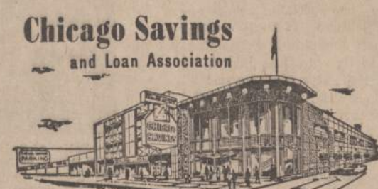
Chicago Savings and Loan Association

BIZNIERIAI, KURIE GARSINASI "NAUJIENOSE" — TURIGERIAUSIA PASISEKIMĄ BIZNYJE