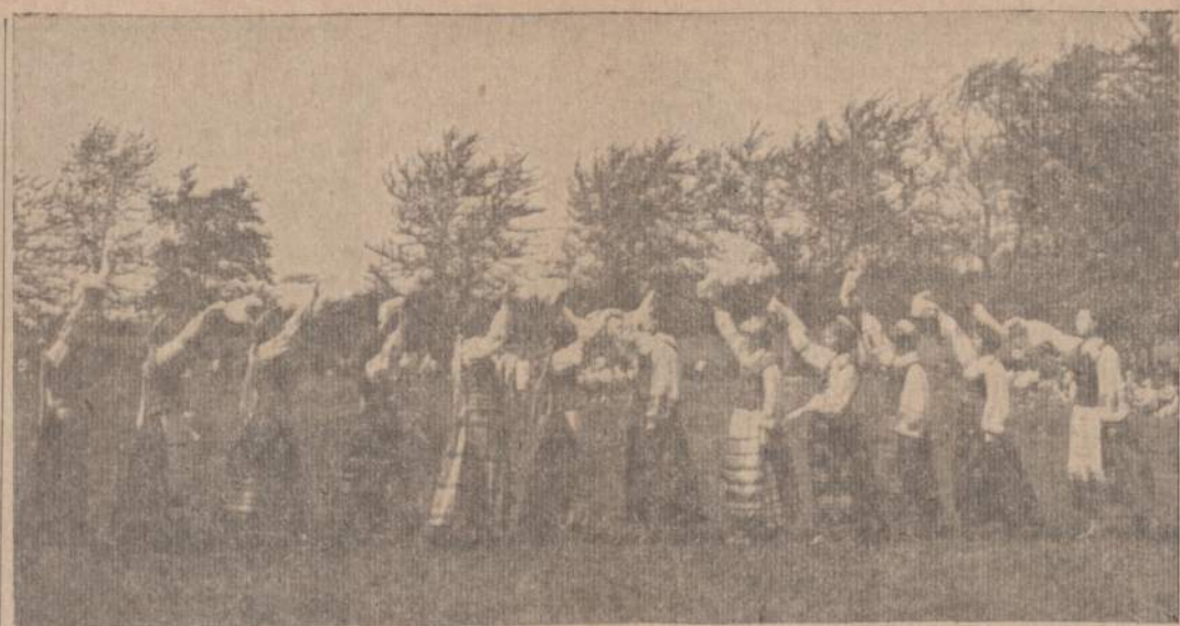
Krist. Donelaičio VII-je Sporto ir Dainų šventėje Aukštųjų mokyklų mergaitės šoka tautinį šokį "Blazdingėlė".

luotam perversmui šūki ir pasirinko sau uždavinį išplėsti. o taip pat organizaciniam ir ideologiniam sustiprinimui savo eiliu gilame pogrindyje vesti sistematingą ir planingą kovą už politinį ir ekonominį darbo žmonių išlaisvinimą. Argi šia tiesa pasakysite: "Lietuvos komunistų partija", "Lietuvos darbo žmonės" kovojo su buržuazine vyriausybe. Kai raudonoji armija ties Varšuva gavo "per nosį", tai "Lietuvos kompartija" ir "Lietuvos darbo žmonės sulindo "po šluota". Kokia nesąmonė! Nei ta Lietuvos kompartija, nei tie Lietuvos darbo žmonės buvo Lietuvos — tai Sovietų Rusijos despotizmo agentai žvalgybi-