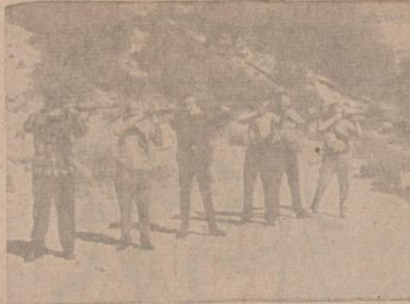
Juozo Daumanto šautiai Frazier kalnuose laike sportinio šaudymo pratimų.

HLN bendrovė už turimą au-to aikštę nuo rugpjūčio mėn. 1