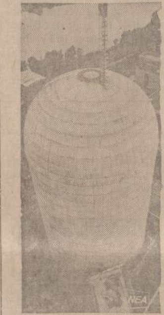
Vakaru Vokietijoje Grosswaltzheimo baigiamas statyti modernus atominis reaktorius, 195 pėdų aukštumo. Ant reaktoriaus stogo statomas bokštas, skirtas oro tyrimams.

Čikagiškis kongresmanas Ro- man Pučinski paruošė planą kovai su Chicago distrikto jaunuolių nusikaltimais (de- linkvencija). Pučinskio bilius autorizuoja $150,000,000 delin- kventų pataisos reikalams per ateinančius 3 metus. Pirmiau- sia bus reformuoti Chicago "tėvų mokykla" (Parental school) nepilnamečių nusikal- tėlių pataisos namai Audy Ho-