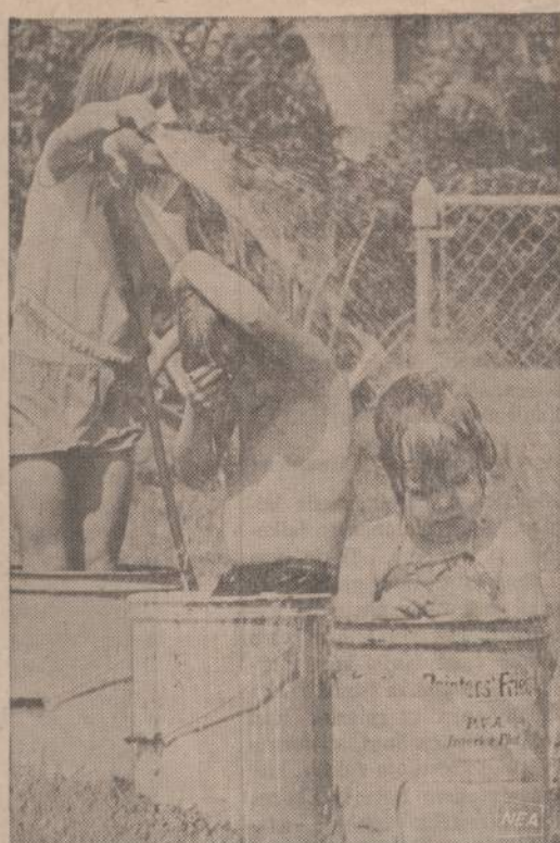
Karštomis vasaros dienomis nedaug tereikia atvėsinoti čia matomus vaikus. Trys didelės tuščios daų dėžės ir vandens žarna.

Jeigu kokie paibeliai būtų skaitymą sutabdę ties 52-ru puslapiu, tai savo nuomone, arba recenzija, galėčiau čia pat užbaigti, patvirtindamas pirmojo numeruoto puslapio pirmuosius žodžius, pasiškinančius žurnalo kryptį: "Į Laisvę" — Lietuvių Fronto Bičiulių politikos žurnalas", tik žodį "Lietuvių" pabraukdamas vienu brūkšniu, "Fronto" — dviem brūkšniais ir "Bičiulių" — trimis, kad skaitytojas suprastų, jog tai nėra politikos apskritai žurnalas, o tik LFB politikos. Gi LFB politika Naujienų skaitytojais pažįsta gana seniai, galima sakyti nuo to laiko, kai Darbininkų į savo rankas paėmė LFB vyrai ir kai "Altas" ten pradėtas vartoti kaip keiksmazodis. Skaitydamas čia minimą nume-