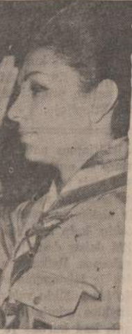
Iranė įvyko Tarptautinė skautų jama-boree. Iranė imperatoriens Farah, priima skautų paradą.

Stovyklos užbaigimo proga buvo surengtos vadovams ir atsisveikinimo vaisės, už stovyklos ribų, kur vieni kitus atsisveikino šiltais žodžiais ir pasiūlymė dovanėlėmis. Vienybė — galybė, sugyvenimas Tėvynės labui! Tai šūkis, kuris praktiškai ir buvo gyvas visą stovyklos metų. Šias nuotaikas jautė išgyveno ir jaunimas.