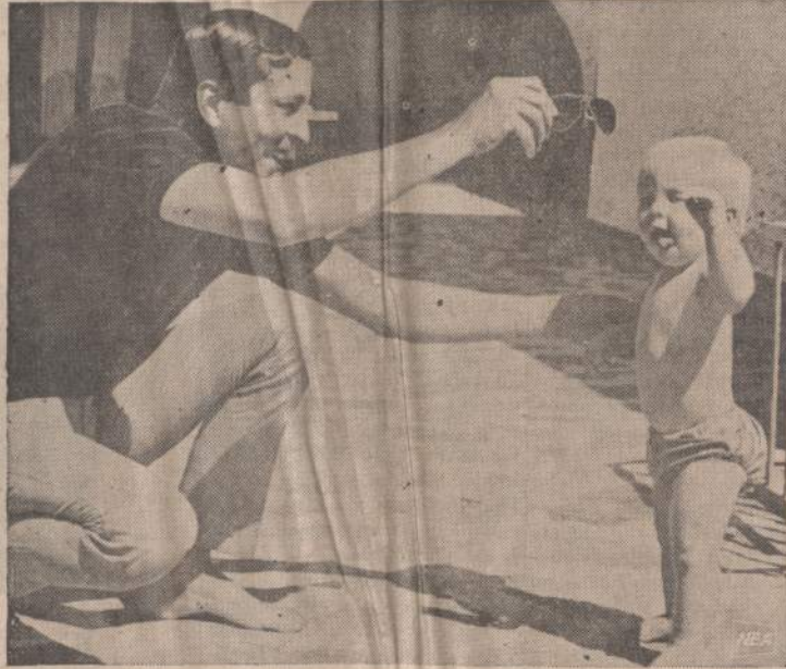
Princas Claus von Amsberg, buvęs Vokietijos diplomatas, žaidžia su savo 14 mėnesių sūnum, princu Willem-Aleksander. Jo motina yra Olandijos sostų įpėdinė, princesė Beatrix.

skleidžiamas pats žmogus. Tiknuos — nors gal ir klystu, — kad ateis toks laikas, kada charakteristikų niekas nereikalauja ir niekas jų nebeprašys. Bent tokių, kaip kad rašome dabar. Bet dabar daugeliu atvejų jos rašomos. Reikalauja jų mokyklos ir teisingumo organai. Rašo jas kolūkių valdyba ir gamyklos administracija. Sutikime, kad kartais jų reikalaujama ir ten, kur nebereikėtų, o kad tik apsidraudus nuo galimų netikėtumų... (E)