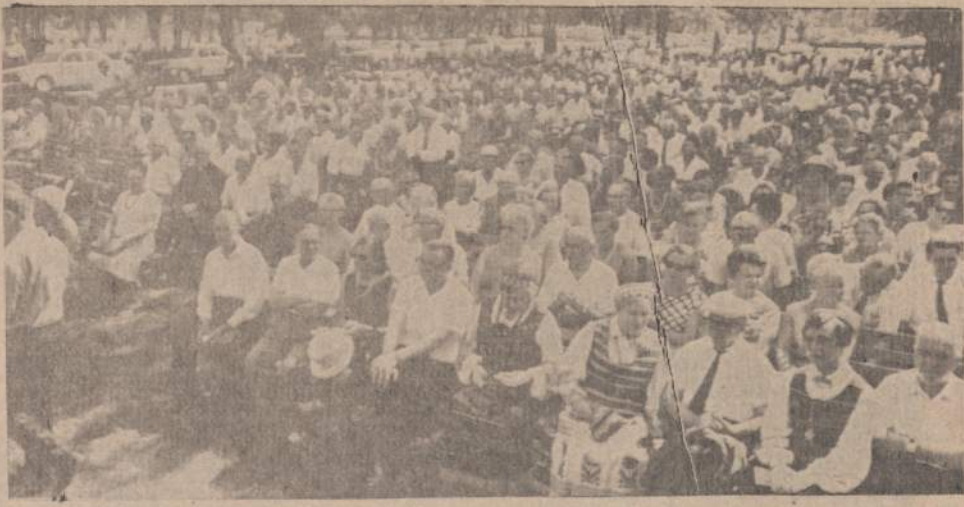
Šių metų liepos 14 dieną prie Dariaus Girėno paminklo, esančio Chicago Marquette Parke, buvo suruoštas skridimo per Atlantą minėjimas. Paveikslė matome susirinkusius Dariaus ir Girėno draugus, padėjusius jiems suorganizuoti skridimą. Susirinkusieji klausia kalbų apie skridimo organizavimą ir nelaimę.