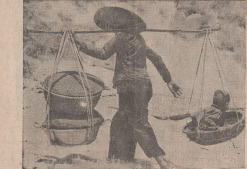
Vietnamo moteris iš lazdos pasidėrė nacišius ir nešasi ne tik savo kūdikį, bet puodą su daržovėmis ir pintine su drabužiais. Vietname susisiekimas išardytas, viska moterims tenka nešioti. Visoje Saigono apylinkėje šeimos maitinimu rūpinasi tikrai moterys.

"Čia jums ne Rusija, mes esame Čekoslovakijoje". Rusai tada nusivirė suimtuosius į čekų policiją. Po penkių valandų laukimo amerikiečiams buvo pasakyta atiduoti filmus rusams. Kai jie atsakė ir pareikalavo pasimatyti su vyriausybės pareigūnais, nuovados viršininkas vėl pranyko ir po kiek laiko sugrįžęs su dviem sovietų karininkais pareiškė: "O. K. Jūs galite eiti". Šį įvykį papasakojo CBS televizijos filmuotojas McLaughlin.