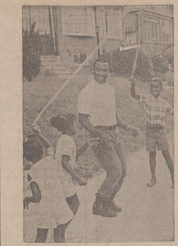
Sunkaus svorio čempionas Joe Frazier ruošiasi naujoms rungtynėms. Ties savo namais Philadelphiaje, Pa., jis žaidžia su savo vaikais. Sunkaus svorio čempionas jam oficialiai pripažintas Illinois, Massachusetts, Maine, New Yorko ir Pensilvanijos valstijose.

Tai buvo jaunas inžinierius. Jis domisi įvairiom senienom. Jis pasiteiravo, ar pas mane kartais nėra užsilikusių senų knygų. Pas mane dar yra kelios senos knygos, bet man rūpėjo patirti, kuriam tikslui dypukams reikalingos senos knygos. Naujos kny-