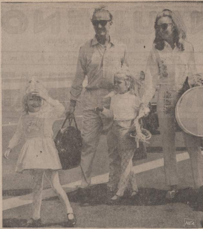
Kino artistas David Niven kartu su savo žmona ir dukterimis atskrido į Pietų Prancūziją vasaroti. Prancūzų Rivjeroje ir Nioje jis rengiasi praleisti vasaros karščius. Nespejo jis išlipti iš lėktuvo, jį jau apspito fotografai.

Pėdos gydymas, paprastai, ne-reikalauja skubios veiklos. Vaikščiojantiems žmogui retai kyla