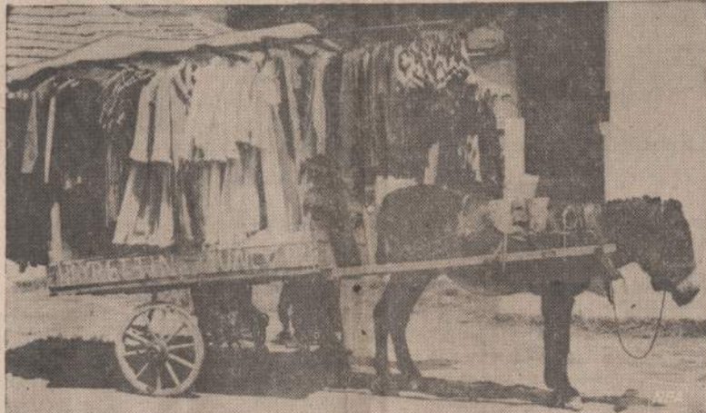
Turkas, pasikinkęs asiluką, po kalnuose esančius tolimus kaimelius vežioja įvairiausius drabužius. Jis pardavinėja sukneles, sijonėlius, vyriškas eilutes ir įvairiausius darbinius drabužius. Jis turi gražiausių baliams sukne lų ir vedybinių aprėdalu.

64 reikalingo žibalo įsiveža iš Viduriniųjų Rytų, o kita 25% — iš Indonezijos. Žibalo importai 1966 metais Australijai kainavo 246 milijonus dolerių, kas sudaro 8% visų australų importų.