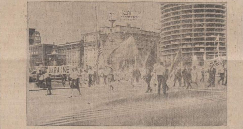
Chicagoje liepos 20 d. įvyko Pavergtų Tautų paradas. Paveiksle matome ukrainiečius, nešančius vėliavas State gatve. Parada priėmė Illinois gubernatorius Shapiro ir Chicago meras Richard J. Daley.

kasu ir abipus Promenados tilto policijos sargybos atitvertai besimaudančių adomų ir ievo, kiek čia per liepos ir rugpjūčio mėnesius žmogienos margu liuoja vos užmatomu paplūdimiu nuo buvusio Rambyno iki Ventos ir Baltijos — ir daugiausiai tik lietuviai ir lietuvės, kaip iš kalbos galima atskirti. Viešpatie, kaip daug verta yra viena tokia laiminga diena, praleista savųjų tarpe savųjų paplūdimyje, kur krante išskėsti didžiuliai spalvoti saulesargiai, ant smėlio išsitiesę ir visai susiraitoję rudi, paraudę, pajuodę ir dar visi balti kūnai, didžiausia dalimi jauni ir jaunos... o čia pat vandenyje taškosi-blaškosi, nardo, plaukti moko, ant matrasų plūduriuoja, krykštuoja — klega linksmi laimingi veidai nuo mamų rėkimo kaulais atsargiai gilyn savomis jėgomis brenančių — visi saviškiai, kaip Palangoje!