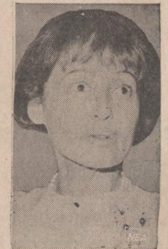
Kino artistė Luise Rainer Italijoje, Spoleto miestelio metinėje muzikos šventėje visu buvo pagerbi. 1936 metais ji buvo pripažinta geriausia metų vaidintoja, o 1937 metais gavo Oskarą už vaidybą "Gerioje žemėje"

— Rudeninis Naujienų pik- nikas įvyks Bučo sode, rugpiū- čio 18 dieną. Bus įdomi pro- grama.