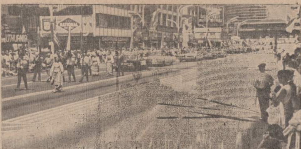
Šių metų liepos 20 diena Chicagoje miesto centre surečiama Pavergtų Tautų parada. Žygiuoja lietuviai, ukrainiečiai ir kiti.

Kaip dalykų surėdyme vienas dalykas nuo kito priklauso. Nė kiek neperdedant, pernai dėl žuvelių juodojo maro nebe tik paplūdimiai buvo pasidarę atgrasinantys, bet ir pats Michiganas dvokė lavonine. O šiemet, aną sekmadienio rytą saulei tekant ir per visą dieną jis vėl buvo mielas, malonus, mandagus ir labai sveingas, net mažus vaikus per toli nužirkliavusius nuo kranto jis šaltesnio vandens bangėmis pataškėdamas švelniai grąžino atgal prie krašto. Kažin, ar Palangos ilgame "pliaže" būdavo daugiau besisaulėjančių, smiltys apsi-