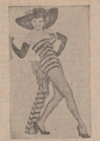
Be Marilyn Monroe, Korėjos karo metu pas karinius buvo galima rasti ir artistės Jane Russell paveikslų. Ji padainuodavo ir pašokdavo Amerikos kariams.