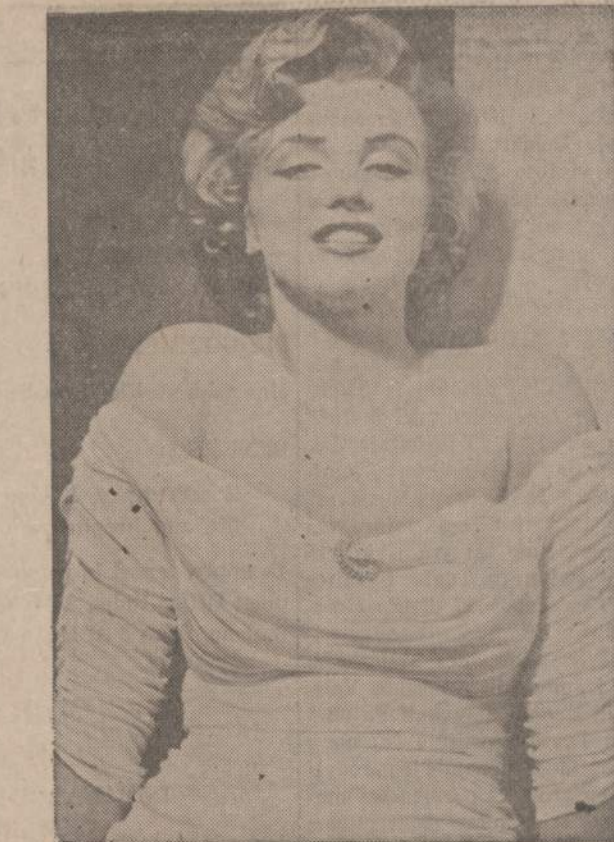
Korėjos karo metu populiariausia kino artistė buvo Marilyn Monroe. Juo mažiau drabužių ji turėjo, tuo labiau kariai ją mėgo. Niekad kita artistė nebuvo tokia populiari, kaip yra buvusi Marilyn Monroe.