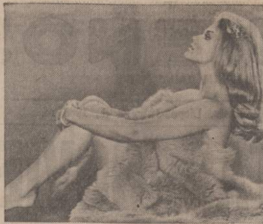
Vietnamo karo metu Amerikos kariai pamėgo visi kitokį moters tipą. Vietnamo karas yra kitoks, negu iki šio metu vesti kariai, todėl kitokios yra dainos ir kitokios moterys. Amerikos kariu labiausiai mėgiama dainininkė ir šokėja yra kailiuose paskendus Ann Margaret (kairė) ir dešinėje matoma Raquel Welch. Niekas tiek nepažįsta Amerikos kariu nuotajų, kaip Rachelės havajiški šokiai ir liūdnai skambančios josios ilgesio dainos.

Trečiadienio pastabose, š. m. 10 d., Tamsta, vertindama tautinių šokių šventę susipainiojai, nors praityje pasitaikydavo visiškai neblogų pastabėlių. Šį kar-