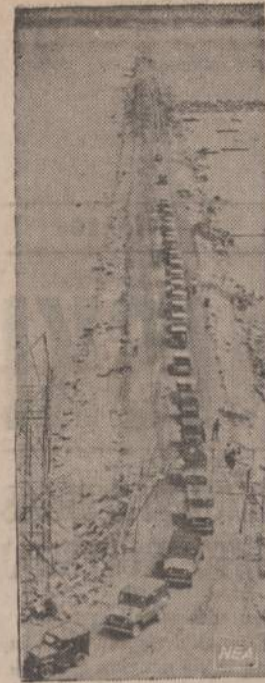
Be Macao, Portugalai valdo dar dvi salas: Taipa ir Coloane. Iki šio mėto Macao susisiekdavo su šiomis salomis tik laivais, o dabar baigtas statyti pylimas, kuriuo gali pravažiuoti automobiliai ir praeiti žmonės. Apskaičiuojama, kad išpiltas pylimas pakels salų pramonę ir padidins prekybą. Kiniečiai labai atidžiai seka kelių tiesimą salose ir tarp salų.

Didelių burnų juodieji rasistai, kaip Karmaikelis, Rap Brown ir pan. gaždina savo spalvotus tautiečius, kad Amerikos