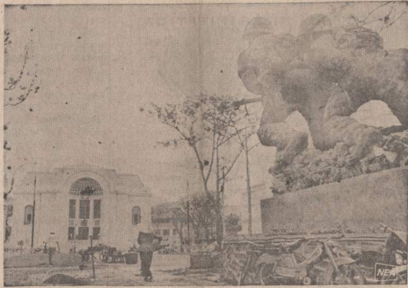
Saigone jau kelinta diena eina gandai, kad komunistai rengiasi mortarais apšaudyti paveiksle matomus valdžios namus. Dešinėje matome vietnamiečių paminklą, šiomis dienomis pastatytą sostinė ginantiems kariams pagerbti.

Stebėtojai galvoja, kad Nasserio kalba apie nuosaukumą ir kantrybę yra pasėka jo kelionės į Maskvą, kur komunistų vadai jam patarė nesikarščiuoti ir ne pradėti naujo karo.