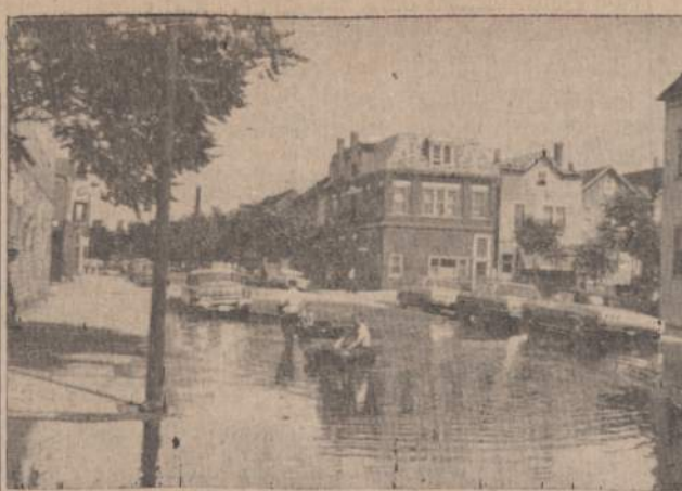
Šių metų birželio 23 Chicagoje gana smarkiai lijo. Lietuvių gausiai apgyven- toje Town of Lake kolonijoje lietus buvo toks smarkus, kad visas gatvės ap- lvdė. Matome Town of Lake kolonijos visiškai apsemta gatvę. Sportininkai net savo laivelius išsivilkė į gatvę, kad galėtų paplaukioti.