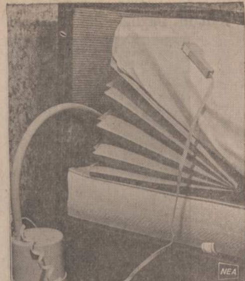
Pripužiamas guminis maišas liginiams pakelia čiuzinį taip, kaip liginis nori. Liginis gali pakelti bet kokį lovos galą arba šoną iki 90 laipsnių. Jam nereikia keltis iš lovos, užtenka pasukti rankena, kad iš greta esančio kibiro suspaustas oras pakeltų čiuzinį. Ši priemonė buvo vartojama ligininėse, o dabar ją gali naudoti ir privatus asmuo.

"Atsiliekame, spręsdami transporto problemas. Pernešyng apkrautas miesto centras, trūksta greitūminiu apvažiuojamų magistralių, tiltų. O transporto esmas nepalyginamai išaugo. Štai kodėl dabar stengiamasi nutiesti kiek galima daugiau tranzitinių magistralių, apėnacinę centrą, padedančių taupyti laiką, lėšas ir žmonių sveikatą. Jau sekantiesiais metais bus atiduota nauđojimui Olandų gatvės trasa tarp Koseiškos ir Polocko gatvių. Rekonstruota Ukmergės gatvės šiaurinė dalis, netrukus ši gatvė, kiek atitolusi nuo Neries, nukryps naujojo tilto Antakalny link. Kai tik statytojai baigs tiltą ties šilumine elektrine, persikels į Antakalnį, ties dabartiniu troleibusų žiedu. Naujas tiltas žymiai pagerins susisiekimą su Valakumpiais bei Rytų Aukštaitija. Susirūpinta ir Polocko gatvės rekonstrukcija. Ja eis greitūminė trasa Naujoji Vilnia — geležinkelio stotis — Panerių gatvė — Kauno plentas. Prašyte prašosi Komjainimo gatvės rekonstrukcija; vakarinė jos pusė bus griauinama, platinamas kelias. Siekiant sumažinti transporto srautą Trakų — Universiteto gatvėmis, kuris labai apsunkina gyvenimo sąlygas ir čia esančių paminklų būklę, norima praveisti naują magistralę iš Basanavičiaus gatvės, kuri kirstų Komjainimo gatvę ir Stuokos — Gucevišiaus gatvės rajone įsiliėtų į Vrublievskio gatvę. Tiesa, šis projektas susilaukė nemažos kritikos.