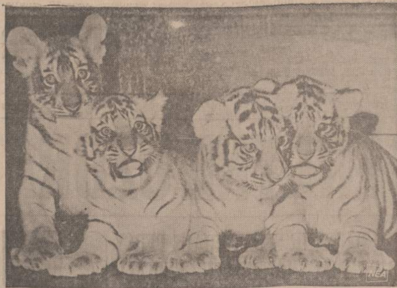
Motina pametė vieną jauna tigrūka, matomą šio paveikslo dešinėje. Bet sena tigrė, auginanti savo tigrūkus, priglaudė ir pamestąjį. Kovą su svetimuoju veda tikrai du mažiukai. Paveiksle matome, kad vienas mažiuku bando nustumti į šalį priglaustąjį tigrūka.