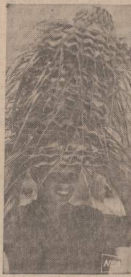
Paveikslė matomas berniukas pardavinėja kokosinės palmės skrybėlaitės. Jis pats nusipirka šakas, jas susiplašo, išsijodina, nusipina skrybėlę ir pardavinėja. Kiekvienas keleivis, tvykes į Guam uostą, mato šį berniuką, pardavinėjantį skrybėles.