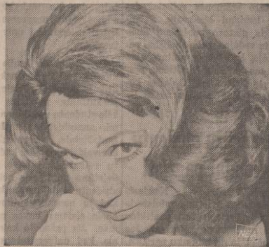
Paveiksle matome paskutinę moterų šukuoseną. Ši šukuosena jau matoma Paryžius teatruose ir kavinėse. Yra pagrindo tvirtinti, kad šį rudenį savus plaukus turinčios ir perukus nešiojančios moterys panašiai šukuos savo plaukus.

Visi lietuviai maloniai kviečiami į "N." pikniką