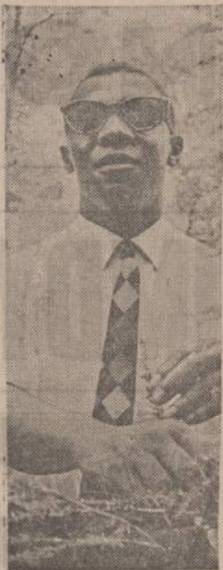
Washington, D. C., atidarytas parkas Amerikos akliems. Kad aklieji galėtų susipažinti su gamta, jie, įsikibę į virvę, nuvedami į parką, kur rankomis turi paliesti augalus ir medžius. Kairėje aklas berniukas čiupinėja augančias žoles, o dešinėje 9 metų mergaitė susipažįsta su naujauju medžio gabalu, žieve ir kelmu. Vietomis brailinėmis raidėmis pagaminti parašai padeda akliems susipažinti. Be Washingtono parko krašte yra dar vienas parkas akliems Colorado valstijoje, Aspen apylinkėje.

Kitas svarbus žmogui mineralas yra geležis. Tik ne iš Geritolio geležį sau senelis turi im-