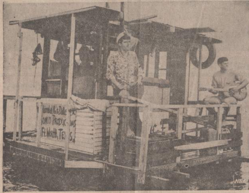
Du jauni vyruklai, prisikaitę Mark Twaino apy sakų, Hannibal miestelyje susikalė paveikls matoma plūde ir pasileido Mississippi vandenimis į pietus. Paveikls jie praplaukia pro St. Louis miestelį. Mississippi vandenimis jie tikisi pasiekti Dallas, Texas, sritį ir baigti kelionę...

"Roma locuta est (Roma pa- sakė savo), "bent tuo tarpu šis reikalas yra baigtas", nuspren- dė Bostono kardinolas Richard Cushing.