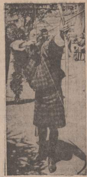
Butano karalius Vangčukas vadovauja svarbesnėm šventėm. Jis visuomet pradeda medžioklių sezoną. Butane uždrausta vartoti šaunamus ginklus. Ten medžioti galima tik su strėlėmis. Kaip pats karalius, taip ir jo pavaldiniai yra geri strėlių šaudytojai.

— Jeigu taip yra tai kiekvienas žmogus turėtų pasireikšti kūrybiniai — nusprendė Silvestras.