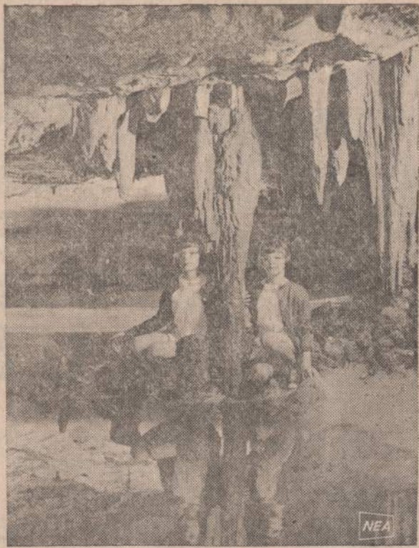
Shenandoah Parko Luray oleje yra ežerėlis. Jis nuolat papildomas iš viršaus krintančiais lašais. Paveikslė matome du jaunas dvy-nukes, sėdinčias šalia augančio stalaktito. Jų paveikslai atsispindi ramiaame ežerėlio vandens paviršiuje.