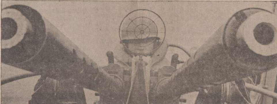
Pietų Korėjos pakraščiu sargybos labai atidžiai seka pakraščius. Jiems įsakyta naikinti kiekvieną šiaurės Korėjos laivą, kuris bando iš šiaurės atvežti ginklų pietu partizanams. Paveikslė matomas dvi kanuolės gali gali pavyti ir greitai bėgant motorinį laivėlį.

Diplomatinuose sluogsniuose Bonoje pabrėžiama, kad, priešingai, sovietai su savo manevrais yra pažeidę Varšuvos pakto sutartį, kuri aiškiai draudžia pakto valstybių tarpe vartoti garantimus. Pakto 8-sis punktas garantuoja abipusę pagarbą nepriklausomybei ir suverenitetui tarp narių ir nesikišimą į narių vidaus reikalus.