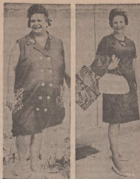
Praeity metų birželio mėnesį New Jersey gubernatoriaus 46 metų žmona svėrė 250 svarų, kaip matyti iš kairėje matomos fotografijos. Dabar ji svėria tiksliai 170 svarų, kaip matyti iš dešinėje esančios fotografijos. Gubernatorienė tvirtina, kad svorius numesti reikiama mažiau valgyti, jokia kito stebuklo nėra.

Vilniaus Krašto Lietuvių Sąjungos centro valdyba praneša, kad Sąjungos JAV ir Kanados kraštų visuotinas su-