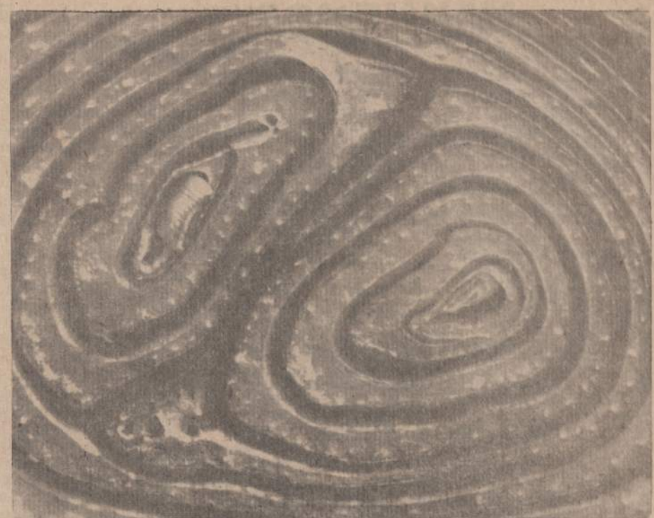
Atrodo, kaip abstrakti tapyba, bet paveiksle matomas tikrai perplautas svogūnas.