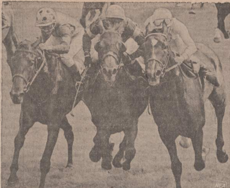
Anglijoje, Lingfield laukuose vykusiame arklių lenktynėse buvo labai sunku nuspręsti, kuris arklys laimėjo, nes visi trys beveik vienodai bėgo. Po ilgų tyrinėjimų ir pasitarimų, nutarta, kad vidurinis atbėgo pirmas, dešinėje antros, o kairėje trečiasis.

Žemės Ūkio Akademija Kaune liepos 26 d. išdavė 170 diplomų. Diplomai šiuo atveju buvo ne agronomų, o inžinierių — mechanizatorių, ekonomistų, buhalterijų ir hidrometeorologų. (E)