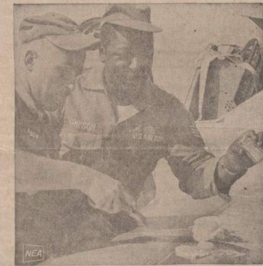
Arizonoje esančioje aviacijos bazėje Amerikos seržantas kiaušinius kepa ant lėktuvo sparnų. Vienas seržantas verčia iškeptą kiaušinį, o antrasis barsto druska.