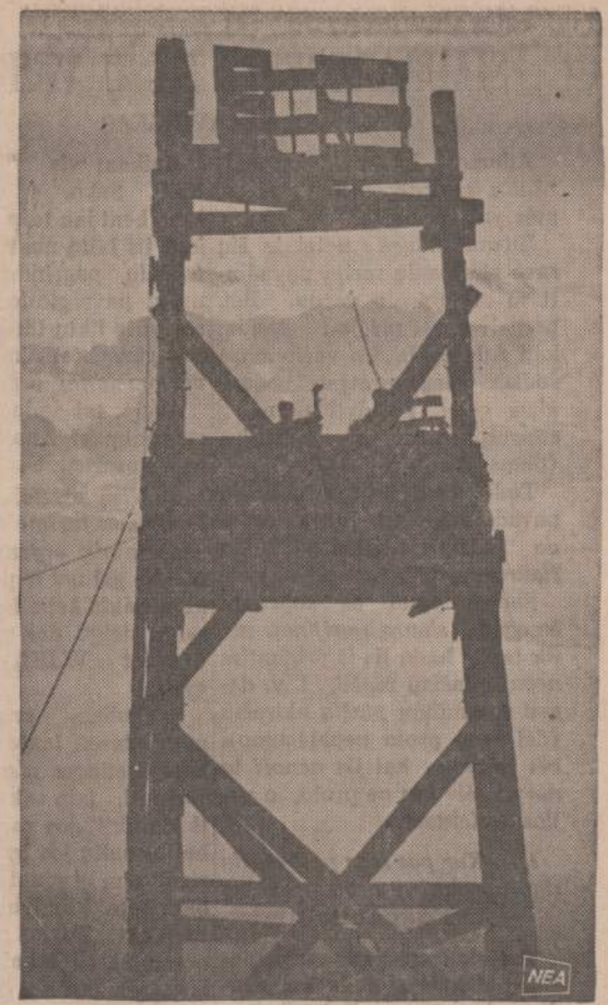
Iš bokšto kariai seka visą apylinkę, kad galėtų pastebėti ir pietus besiveržiančius šiaurės Vietnamo komunistus. Pastebėję priešų artileriją, jie praneša štabui, kuris komunistų lizdus tuojau išnaikina.

Liepos 26 d. Vilniaus laikraščiuose pakebtas Sovietų Sąjungos (ir sąjunginių respublikų) žemės įstatymo pagrindai nesiskiria nuo ligšiol galiojančių nuostatų, tik jie smulkiau nustato žemės įvairiems tikslams naudojimo tvarką ne tik kaimuose, bet ir miestuose ir kitokių tipų gyvenvietėse. Svarbiausias nuostatas pasilieka — "Zemė Tarybų Sąjungoje yra išimtinai valstybės nuosavybė ir suteikiama tik naudotis". Dar būdingiau, kad "Visa žemė Tarybų Sąjungoje sudaro vieningą valstybinį žemės fondą", kurio vyriausiasis šeimininkas yra centrinės Sovietų Sąjungos valdžia. Vadina- mujų respublikų valdžios pa- liekama teisė spręsti tik smulkesnius žemės paskirstymo klausimus "jeigu jie nepriklauso TSR Sąjungos kompeten-