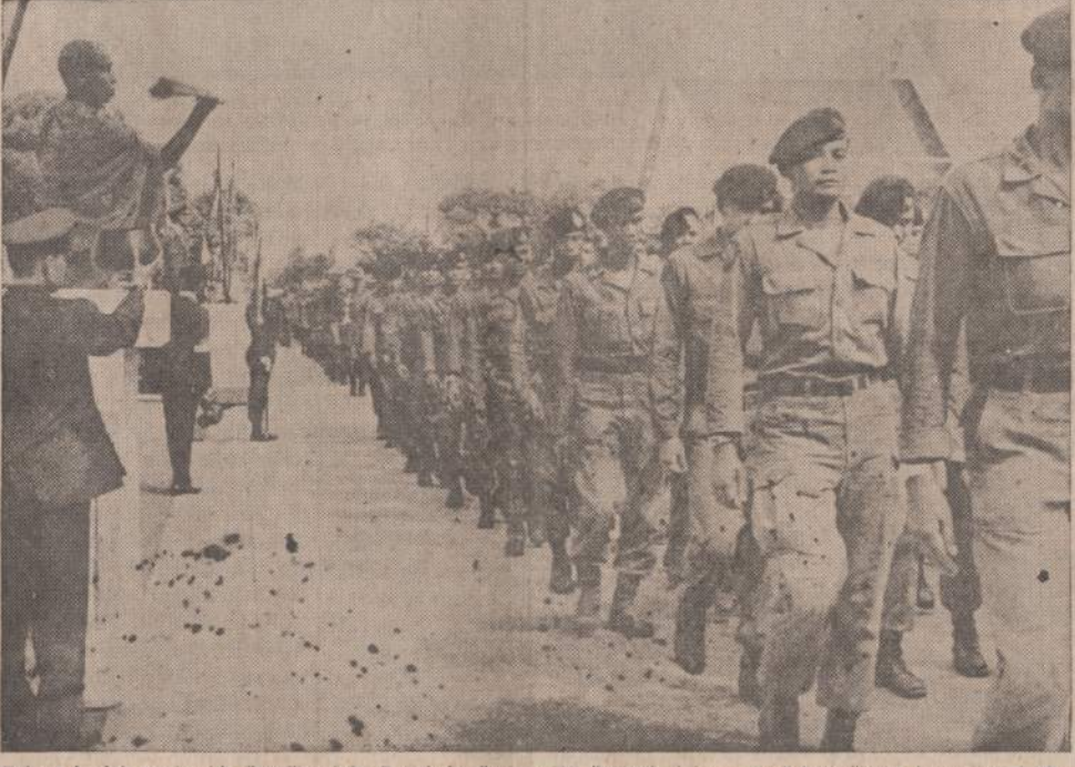
Tajaus kariai, pasimeldę šventiausioje Bangkoko šventovėje, žygiuoja į kovą prieš įsiveržusius komunistus. Budistų kunigas šventu vandeniu šventina kovon žingsniuojantį batalioną.