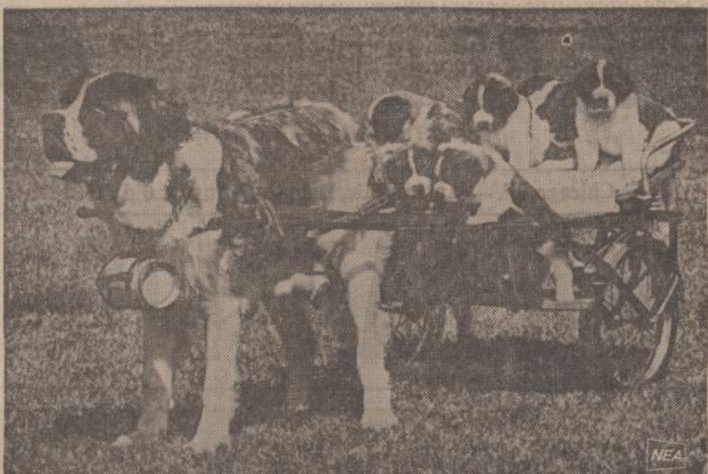
Muncie, Indianos, ūkininkas turi San Bernardą. Šiais metais ji atsivedė 9 ūniukus. Susisodinus juos visus į vežimį, ji išvažiuoja į laukus. Jeigu ištiktytų audra, tai po kaklu ji turi statinėle maisto.

Iš minėtų DOPA vaistų gydytų 38 parkinsonikų net dešimt jų nepagerėjo žymiai. Keturims iš jų nepakito ligos reiškiniai, o šeši iš jų dešimt —