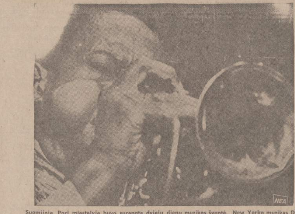
Suomijoje, Pori miestelyje buvo surengta dviejų dienų muzikos šventė. New Yorko muzikas Don Cherry dalyvavo šioje suomių šventėje. Paveiksle matome New Yorko muziką, net per prakaitą pučiančių suomiams savo dūda.

Ryšium su Pavergtų Tautų minėjimu atstovas Edward J. Derwinski (R-III) liepos 26 d. pateikė paskelbti Kongreso Uz- rašuose informaciją iš angliško Eltos biuletenio apie Lietuvoje Sovietų vykdomą rusifikaciją. Paskelbto straipsnio tezės — lie- tuvų kalbai antraeilinė padėtis, literatūros dėstymo programos užtvindytos rusų autoriais ru- sų kalba privaloma, vadovėliai verčiami vien iš rusų kalbos, iš Lietuvos iškeltiesiems lietuviams atimtos kultūrinės teisės, Lie- tuvos istorija nutyliama. — Į Sovietų Sąjungos krepšio- nio jaunųjų rinktinę, kuri ren- giasi dalyvauti Europos jaunųjų krepšinio pirmenybėse Ispanijo-