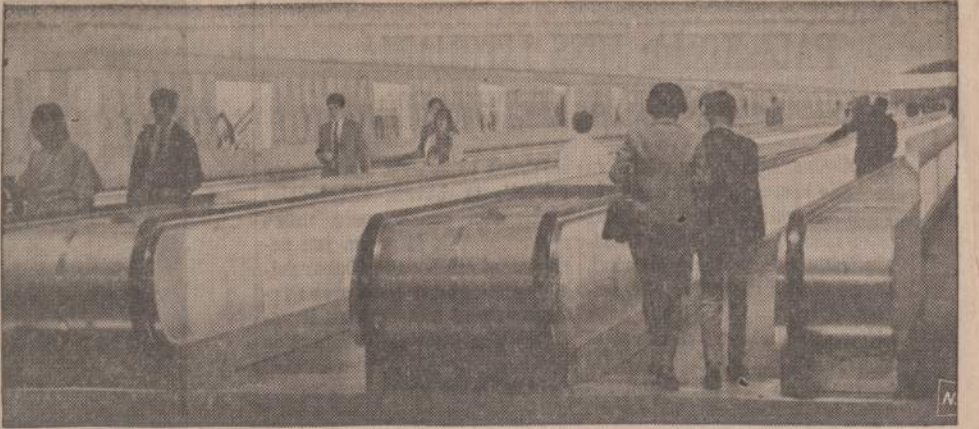
Paryžiuje, didelėje Montparnaso požeminio geležinkelio stotyje, prancūzai įtaisė judamą diržą, einantį dvi mylias ir valandą. Šioje stotyje keleiviams, pereinantiems į kitas linijas, reikia nueiti apie 1,000 pėdų. Pavargusius ir vyresnio amžiaus keleivius judantis diržas tuojau nuneša į pageidaujamą vietą.

Jeigu republikonai rado reikalo amerikiečių spaudai paruošti gana tikslių pranešimų apie lietuvių liudijimą, tai yra vilties, kad jų partijos programoje bus atkreiptas reikalingas dėmesys į šio krašto lietuvių pageidavimus.