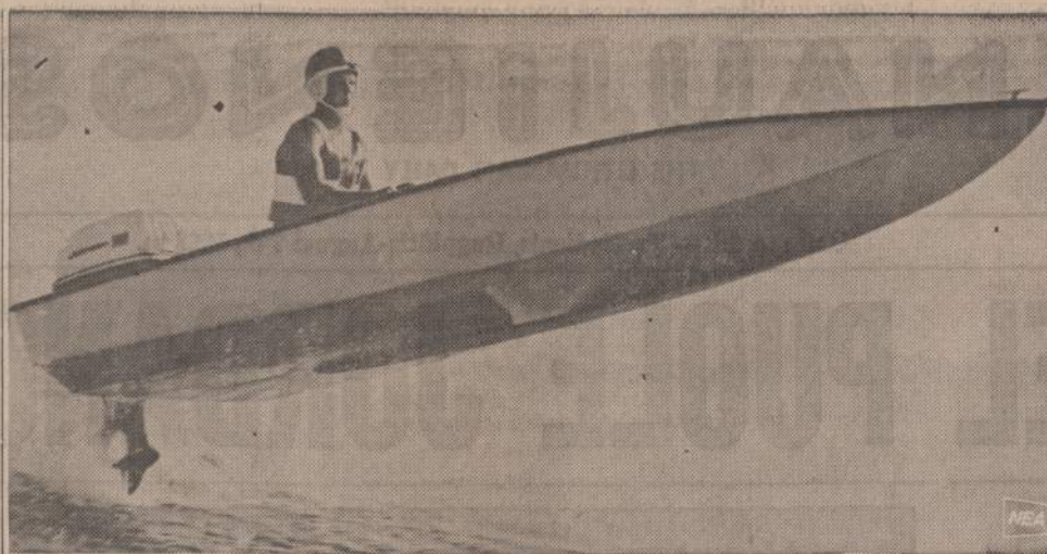
Atrodo, kad iš plaukiojamos oru skrenda. Tokia yra tikrovė, bet labai trumpa. Vairuotojas turi patį naujausią aliuminijaus laivelį, varomą šimto arklio jėgų motoru. Jeigu iš laivelio, plaukdamas visą savo jėgą, patenka į kito laivo sukeltas bangas, tai jis kelioms sekundėms pakimba ore. Mathome tokio būdu skrendantį laivelį.

Įdomus tų dviejų jūrininkų susitikimas: prieš apie 15 metų juodu susitiko ir susipažino New Yorko uoste. Dabar, po tiek laiko, vėl netikėtai susitiko čia Los