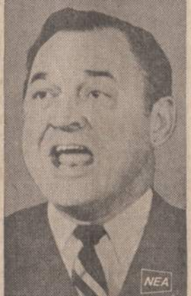
Floridos gubernatorių Claude Kirk aktyviai dalyvauja respublikonų pasitarimuose. Jis nutarė remti New Yorko gubernatorių Nelson Rockefeller, nes jam atrodo, kad jis galėtų laimėti rinkimus. Kirk yra ištikimas, kad R. Nixonas pralaimės.

Ispanijos baskai reikalauja autonominių teisių. Šią vasarą baskų veikla sustiprėjo. Buvo nužudyti keli policininkai, sprogdinti automobiliai. Valdžia sako, jog baskų veikla yra remiama iš užsienio. Baskai turi savo kalbą ir skiriasi nuo ispanų. Manoma, kad jie atvyko į šiaurinę Ispaniją ir pietinę Prancūziją iš šiaurės Afrikos.