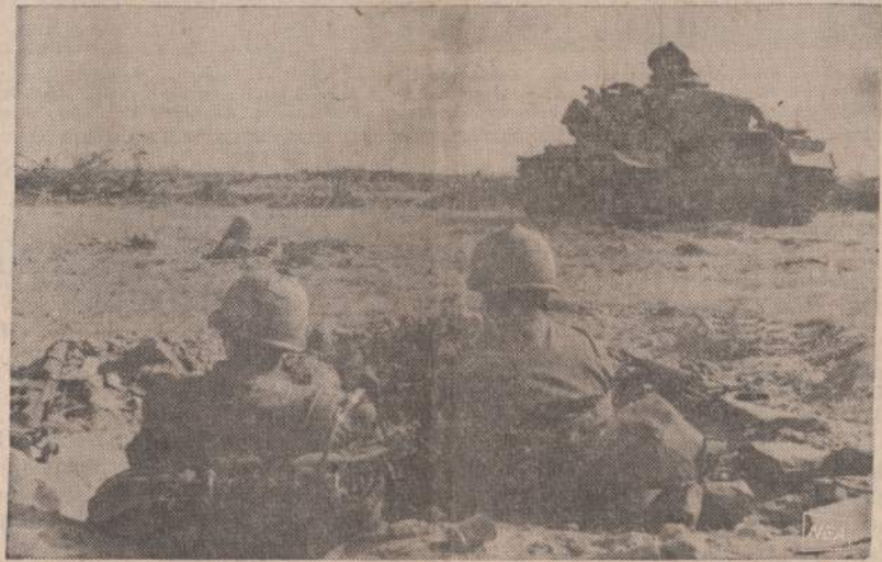
Pietų Vietname, visai netoli demilitarizuotos zonos, komunistai įsitaitė keliuose apkausuose. Amerikos aviacija bombarduoja komunistų pozicijas, o tankas yra pasiruošęs baigti naikinti priešą. Paveikslas kairėje matyti nukritusių Amerikos bombų sproginėjimai. Įsikase Amerikos kariai seka karo veiksmus.

Be šito bendradarbiavimo Čekoslovakijai būtų sunku turėti žaliavų šaltinius ir užtikrintas rinkas savo gaminiamas.