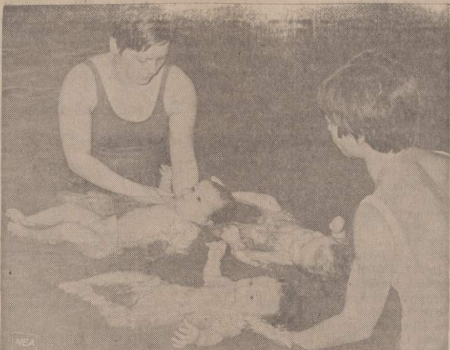
Belgijoje slaugės moko jaunus kūdikius, kaip laikyti vandenį. Dar metų nesulaukę kūdikiai plūduruoja vandenį. Jie taisyklingai kvėpuoja, nebijo vandens, o vėliau, paplūdurė, turi žymiai didesnį apetitą.