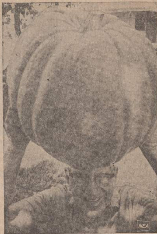
Floridoje šiais metais arbūzai išaugo labai dideli. Vienas Seminole apylinkės arbūzų augintojas rodo, kad arbūzas yra žymiai didesnis už jo galvą. Arbūzas sveria 37 svarus ir yra 49 colių apimties.

Rinkimų programa numatyta sekanti: rugpiūčio 30 d., nuo 6 iki 7:30 val. vakaro, Statler Hilton viesbuty (Seventh Ave. and 32nd St., New York, N. Y.) Le Petit Cafe patalpoje — su-