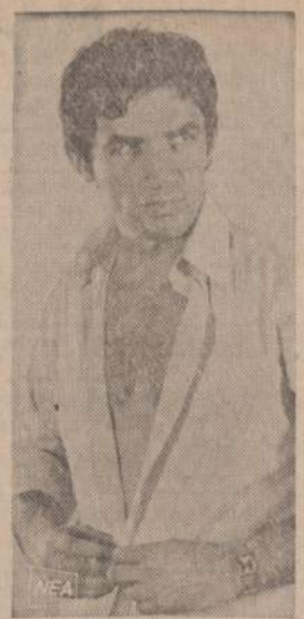
Anksčiau geriausias kino artistas skaitėis tie, kurie gražiausiai atrodėdavo ir geriausiai apsirengdavo. Šiais laikais kino artistas turi atrodyti grubus, kampuotas, o dažnai ir gauruotas. Paveiksle matome naujai kylantį Jugoslavijos artistą Bekim Faymu, kuris gauna daugiausia pasiūlymų vaidinti naujai ruošiamuose filmuose.