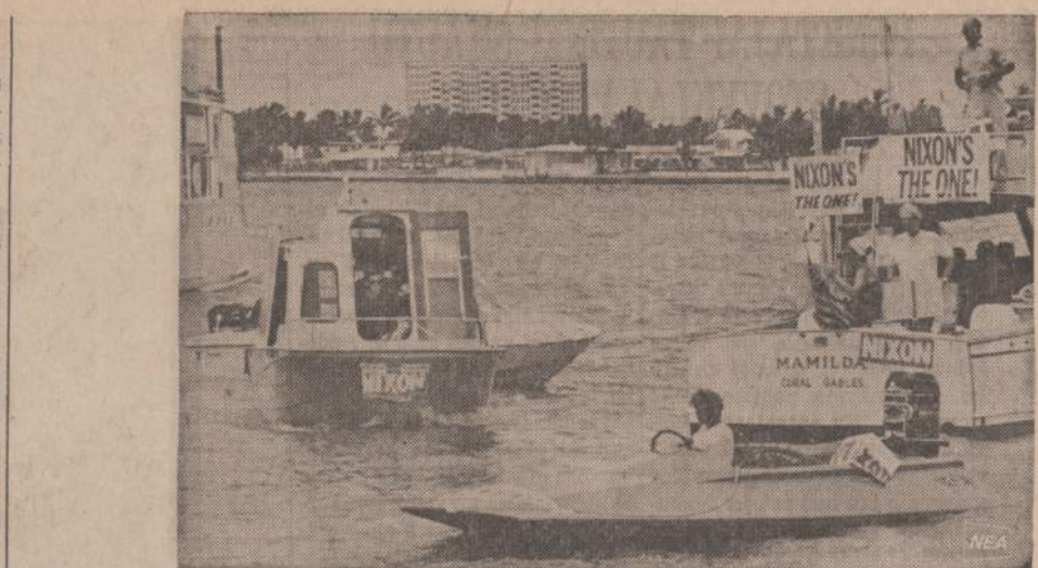
Richard Nixon, buvęs laivyno karininkas, Miami Beach uoste suorganizavo savo laivyną, kuris vedė vykusią propagandą respublikonų konvencijos vandenyse. Paveikslė matome Nixono šalininkų suorganizuotą partinį laivyną.

Vienas Philadelphiaus lietuvis, šiomis dienomis buvęs Lietuvoje, turėjęs progos penkias dienas praleisti Vilniuje ir išsikalbėti su savo giminėmis, mums rašo, kad areštai Lietuvoje eina per paskutinius tris mėne-