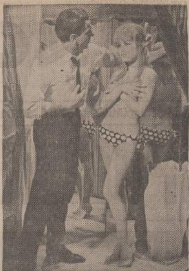
Prancūzų artistė Brigita Bardot taip pat pateko į Kalifornijos vaikinių figūrų muziejų. Ji pavaizduota tokia, kokia ji buvo labiausiai mėgiama josios filme, vaizduojančiame Pacifiko salų moterų gyvenimą.

Žaidėjai buvo paleisti tik po to, kai jie raštiškai atsiprašė teisėjo ir... Kolumbijos futbolo mėgėjų.