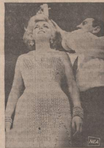
Paveiksle matome vaikinę Marilyn Monroe, stovintį Kalifornijos kino artilsių muziejuje. Jos plaukai taip sukuojami, kaip ji gyva juos šukuodavo.

Gynybos departamento taupymo programa rišama su kongreso priimtu, prezidento Johnsono prašytu, mokesčių pakėlimu. Kongresas sutiko pakelti mokesčius tik su sąlyga, kad vyriausybė sutaupys 6 milijonus dolerių. Gynybos departamento taupymo užtikrins pusę tos sumos — 3 bil. dolerių.