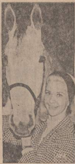
1948 metais kanadietė Ann Scott Šveicarijoje laimėjo Olimpiados čiuožimo čempionatą ir gavo aukso medalį. Šiandien ji įdėtinėja arkliais Čikagoje. Jai pavyko laimėti 21 lenktynes ir parsivežti namo 64 kaspinus.