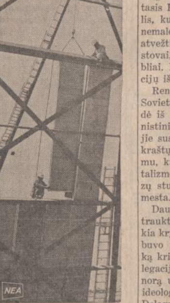
Los Angeles didžiajame aerodrome įtaisė didelės fibros plokštes, kad bent kiek sumažintų galingųjų srausinių lėktuvų užėmimą. Specialistai apskaičiavo, kad dedamos plokštės sumažins keliamą triukšmą. Visi kiti aerodromai atidžiai seka bandymus užsiūti sumažinti Los Angeles aerodrome.

NEW YORKAS. — Nedidelė namie gaminta bomba sprogo Amerikos komunistų partijos prieganyje. Sužalotos duros ir langai.