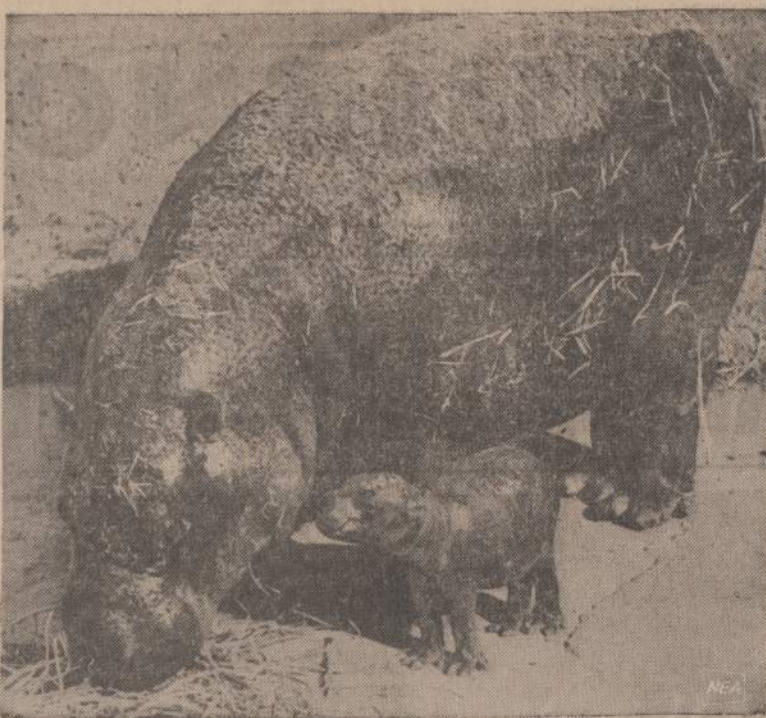
Australijoje, Sydney zoologijos sode prieš 7 dienas gimė šis mažas hipopotamiukas. Jis yra 8 colių aukščio, jau gali sekioti motiną. Tai mažoji hipopotamų veislė.

Atlikęs savo "misiją" Karmaikelis kaip nieko dėtus grįžo į JAV. Buvo rašoma ir kalbama net pačių senatorių, kad jį reikia bausti už šalies išdavimą, bet, atrodo, laimėjo Amerikos laisvių tradicija, kad besinaudojant žodžio laisvė valia bet ką šnekėti, kol nieko nedaro. Pagaliau Karmaikelis vedė žymią Afrikos negrų filmų aktorę, nusiramino, nusipirko Washingtono rezidenciją už $70,000 ir atrodė ramiai atsidadė patenkinti