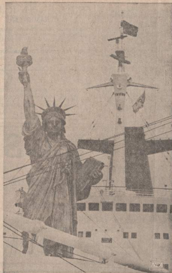
Atrodo, tarytum laivai būtų apsupe New Yorke esančia Laisvės Statula, bet tikrovė yra visai kitokia. Italai rengiasi sukurti filmą New Yorke. Jie pasidarė plastikine Laisvės Statula ir atsivežė į New Yorką.