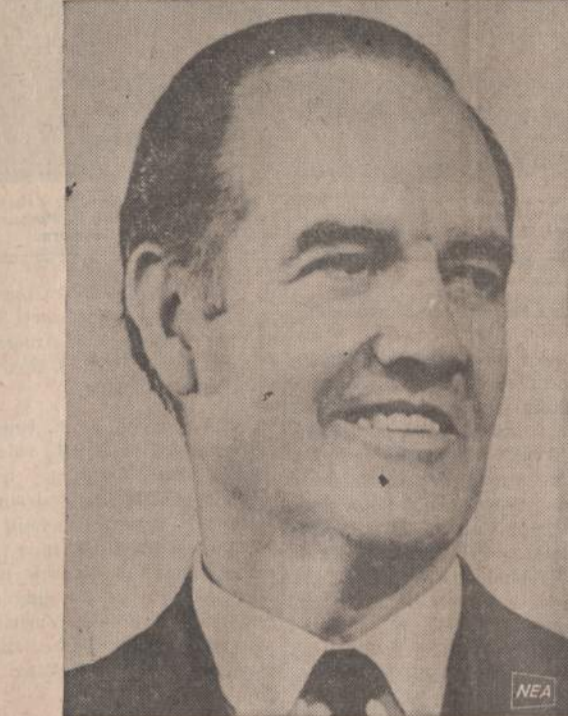
Gub. George McGovern nori būti Demokratai Partijos kandidatas į prezidentus. Jis yra įsitikinęs, kad geriausiai suprato sen. Kennedy, bet žuvusio senatoriaus šeima kitaip galvoja.

Bogotos miestas Eucharistinio kongreso proga paverstas į sustiprintą tvirtovę, kurią saugo 14,000 automatais ginkluotų kareivių ir policijos. Žurnalistas Bogotą jau pavadino "koncentracijos stovykla". Trys "El Tiempo" reporteriai buvo policijos pagaliais apkulti, kad nesėję parodyti asmens dokumentų. Airijos kardinolas William Conway nebuvo įleistas į Eu-