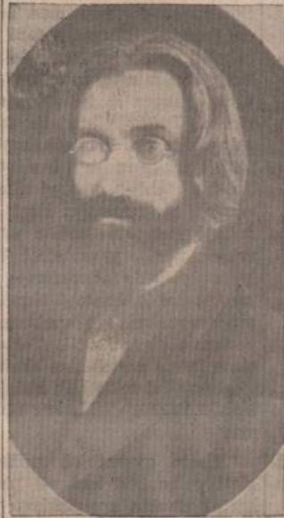
Vydūnai — 100 metų. Vistiek ar jis gyvas ar miręs. Lietuviuose jis gyvens dar kitą ir dar kitą šimtmetį... Daug kas mūsų (ir po mūsų) mirs, bet Vydūnas "gyvens"...

Kad šiometinė Vadovo viršelis, keturi viduje puslapiai ir keli pakraščiai išimtinai žaliai piešti į baltą dugną, gal ir nebloga, jeigu siekiant įvairumo, nenubodu. Tik viršelyje vytiš raudoname apskritimelyje ta liesoji, lyg šaka, kuri buvo ir ant lapkričio 13-sios rinklaivinių žyginukų skydelių ir kitur panašiais atvejais. Tačiau buvo nuomonų, ir mano, jei kovojame už konkrečią Lietuvą, tai šios šventės leidinio viršelyje labiausiai derėjo konstitucinio stiliaus valstybės ženklas — vytiš. Rodos, valstybių herbai nėra mados dalykas, ir pagal tapybinę pakraipą oficialiai visuomenei rodomieji neperkuriami, kaip ir nebuvo perkurti tieji salėje išstatytieji herbai. Jeigu rodomas valstybės ženklas perkurtas, ar naujai sukurtas, ar neturėtų būti programoje parašyta kūrėjo pavardė, kaip parašomos visų kitų autorių pavardės. Būtų gera, kad mums apie tai paaiškintų mūsų valstybės tęstinumo atstovai.