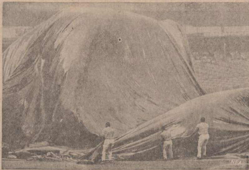
New York Yankee Stadione ištostas didelis brezentas staigiai pradėjo kilti. Susidarė įspūdis, tarytum po juo būtų palindęs didelis banginis. Vyrai laikė brezentą, kad jis aukčiau neiškiltų. Pradėjus vėjui pūsti iš kitos pusės, brezentas nusileido.

Tai pirmiausia dalis karo metu pabėgėlių jauniesiosios kartos. Jų kilmė yra grynai lietuviška, bet kasdieninis susitikimas su vokiečiais, pagunda įsiliesti į vokiečių tautą taip sumurgdo jaunuolį, ypač jei jis iš tėvų pusės nepajuto gyvo lietuviškumo, o tik tradicinį, kad jis dažnai nežino kelio. Kuriuos