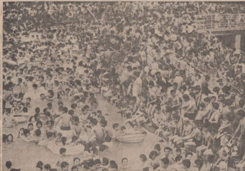
Varšavos karščiai spaudžia ne vien amerikiečius, bet ir japonus. Paveiksle matome 60,000 japonų, suvažiuosiu į Tokijo paplūdimį. Iš fotografijos matyti, kad susigrūdimas didelis.

PARYŽIUS. — Penkių šimtų magų metinė konvencija Paryžiuje virto susidomėjimo centru savo neįtikėtinomis išdaigomis. Jų praktikuojamoji magija yra daugiausia cirkinio pobūdžio, tokią kaip išsilaisvinimas iš maišo, kuriame magas yra užrištas ir pakabintas į Eifelio bokštą, moterų pusiau perpiovimas ir t. p.