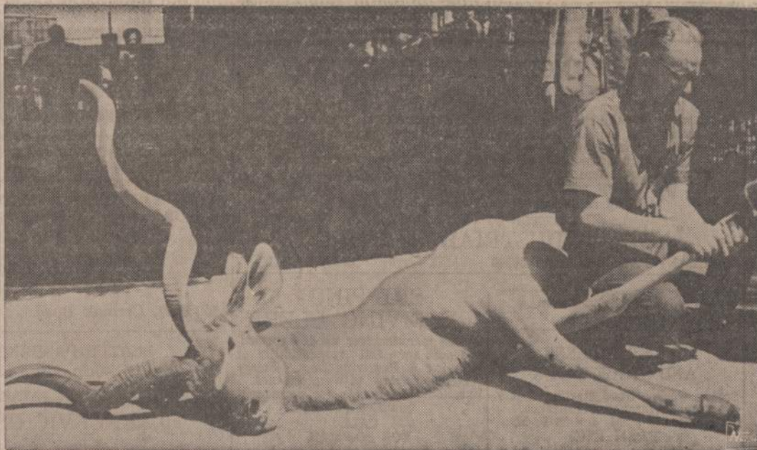
Paveiksle matomai antelopei pradėjo pleišėti kanopos. Frankfurto zoologijos sodo veterinaras įšvirkštė antelopei migdančių vaistų, apipiaustė kanopas ir vėl paleido raguotį.

GYDYTOJAS IR CHIRURGAS Bendra praktika, spec. MOTERŲ ligos Ofisai: 2652 WEST 59th STREET Tel.: PR 8-1223 OFISO VAL.: pirmadienį, antradienį, trečiadienį, penktadienį, 2-4 ir 6-8 val. vak. Šeštadienį 2-4 val. po pietų ir kitu laiku pagal susitarimą.