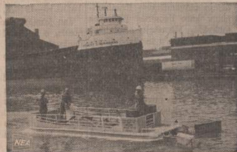
Prietaisas aliejui sugerti. Paveikslo matomas laivas vienos valandos laikotarpyje nuo vandens paviršiaus gali sugerti 2,100 galionų aliejaus arba kitokio lengviojo skysčio. Viskas taip įrengta, kad negali įtraukti vandens. Fordo bendrovė pasistatė šį laivą į Dearborn, Mich., vandenims valyti.

Prisidirbę tų tarp savęs prie-štaraujančių projektų, Europos "Bičuliai" dabar turi bėdos su išsiaiškiniu, kuris jų geras.