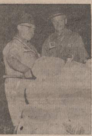
STOVYKLINĖS GYVYBES UGNIS

Penkios dešimtys stovyklų, Penkios dešimtys laužų, Lietuvos padangė žėrė Penkios dešimtys aušrų.