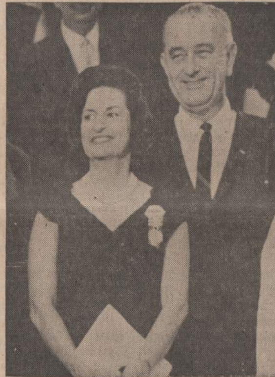
President Lyndon Baines and Mrs. L. B. Johnson of the U. S. A.

Wish National Anthems Estonia Latvia Lithuania This Album Privately Paid for by a Friend of the President's Boyhood