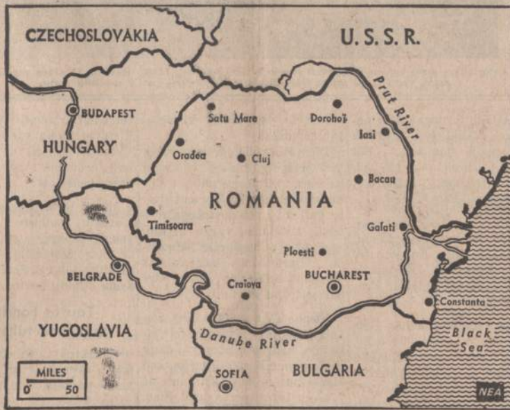
Komunistinė Rumunijos valdžia bijo, kad rusai, okupavę Čekoslovakiją, nebandytų ir Rumunijos okupuoti. Bukaresto valdžia paskelbė mobilizaciją ir sustiprino visą pasienį. Rumunijos komunistai pasmerkė rusus, įsiveržiusius į Čekoslovakiją.

Akivaizdoje viso to, kas įvyko, ar tai bus padaryta tarp demokratų — tai didelis klausimas.