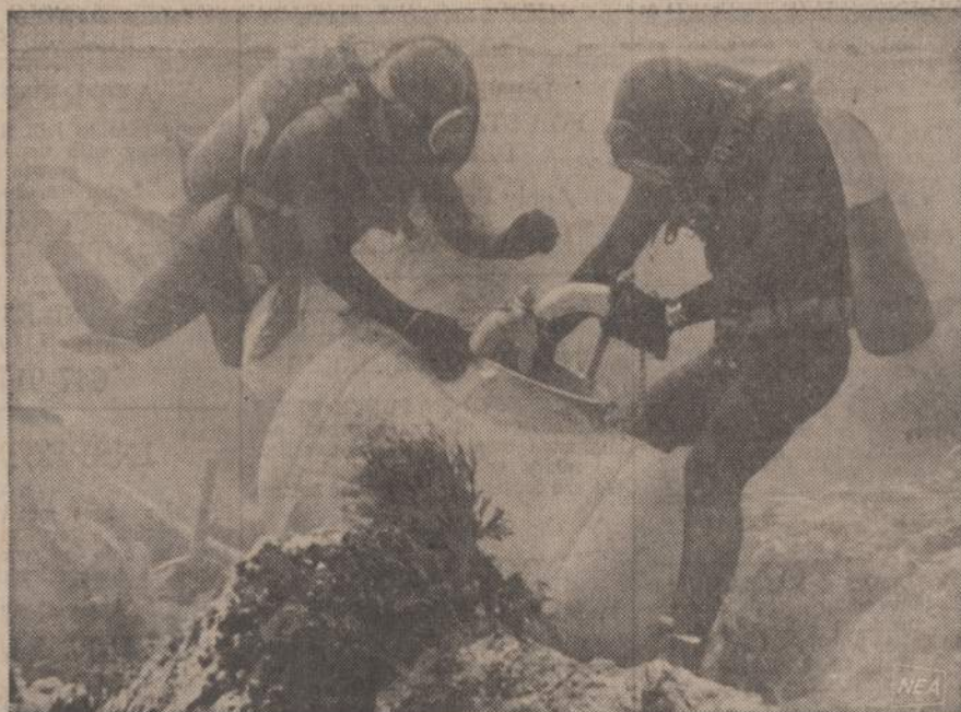
Kalifornijos pakraščiuose narai gauda jūros gilumoje esančias žuvis ir deda į specialią suspaus- to oro statinę žuvis, kaip ir žmonės, neišlaiko, jeigu staigiai pakeičiamas vandens spaudimas.

Lėšų telkimą lituanistinėms mokykloms paremti, kaip pa- reikšė D. Sukelis, reikėtų or- ganizuoti: vają, pramogą ir Navy Pier rudens tarp. mūgę. Ta kryptimi ir daromi visi pa-