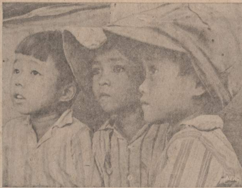
Trys vietnamičiai vaikai laukia Amerikos gydytojo Da Nang srityje. Amerikos marinių gydytojai tikrina sveikata civilių gyventojų. Vaikai bijo stipresnių išvirkštimų.