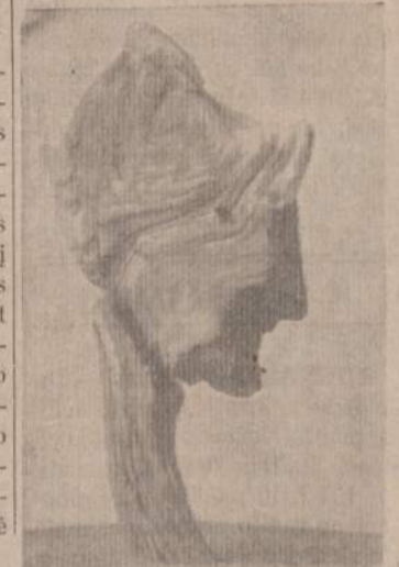
Gamtos skulptūra. Panašiu gamtos metamorfozų buvo ir Jurgio Kasakaičio foto nuotraukų parodoje Baltzko muziejuje.

Tai ta pati bažnyčia, kurioje negrų jaunų padaužų organizacija Rangers buvo gavusi prieglaudą.