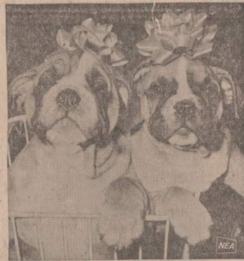
Dviejų mėnesių buldogai, laimėję vainikus Bradenton, Fla., įvairiausių šunų parodoje.