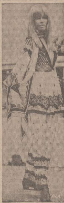
Londono mados salone pasirodė nauja moteris paveiksle matomais drabužiais. Tvirtinama, kad nei viena kita modistė neturėjo taip atsegtos krūtinės, kaip paveiksle matomoji.

Susirinko itin skaitlinga minia, taip apie 10,000 žmonių. Bet