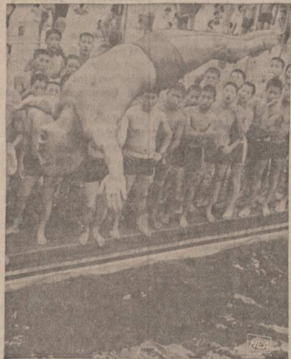
Tarptautinėje olimpiadoje aukso medalį už plaukimo laimėjus amerikietis Sammy Lee rodo korejiečiams, kaip plaukti ir nepavargti. Sammy Lee yra kilęs iš Korejos.