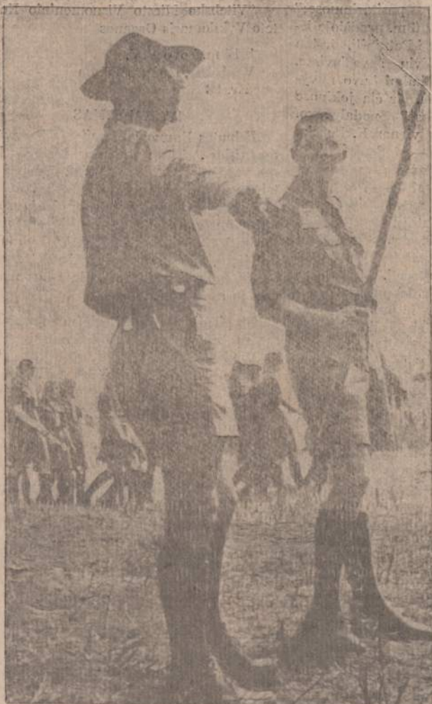
SUKAKTUVINĖS STOVYKLOS PARADO TVARKYTOJAI