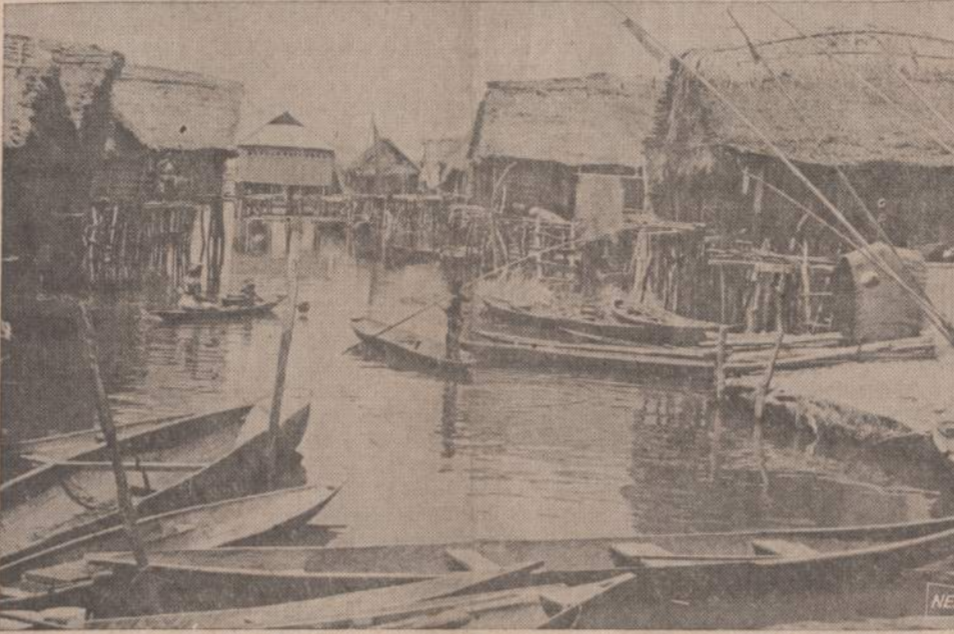
Naujai Afrikoje suorganizuotoje Dahomey respublikoje Ganvie kaimelio gyventojai gyvena ant stulpų pastatytose lūšnose. Jie susisiekia plokščiais laiveliais, lengvai pralendžiančiais siaurais takais.

PRAGA. — Aleksandras Dubčekas, Čekoslovakijos komunistų partijos generalinis sekretorius, laikraščių redaktoriams padarė pranešimą apie savo pasitarimą Maskvoje. Kadangi jo kaktas buvo "sulopyta", tai vienas redaktorių paklausė, kas atsitiko. Dubčekas atsakė, jog jis pakritęs vonioje ir prasimušęs kaktą.