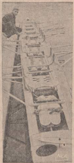
Olimpiniai laivai, kuriais jauni irkl- ininkai rengiasi rungtis Meksikoje pla- nuojamoje olimpiadoje. Laiveliai ne- turi sverti daugiau 44 svarų. Kiek- viena sėdynė yra padaryta pagal irk- lininko kūno išmėras.