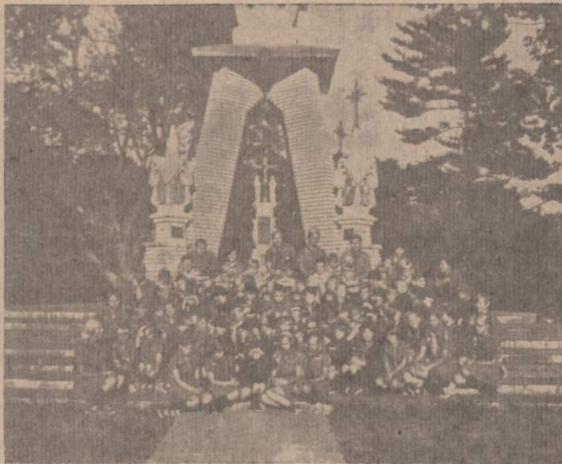
ATLANTO RAJONO VILKIUKAI IR PAUKŠTYTĖS SU SAVO VADOVAIS

Vėl tūkstantis rankų kyla salnui į viršų, ir himno žodžių įkandin leidžiasi vėliavos; praeities vieškelin nulydėta dar viena Tautinės Stovyklos diena.