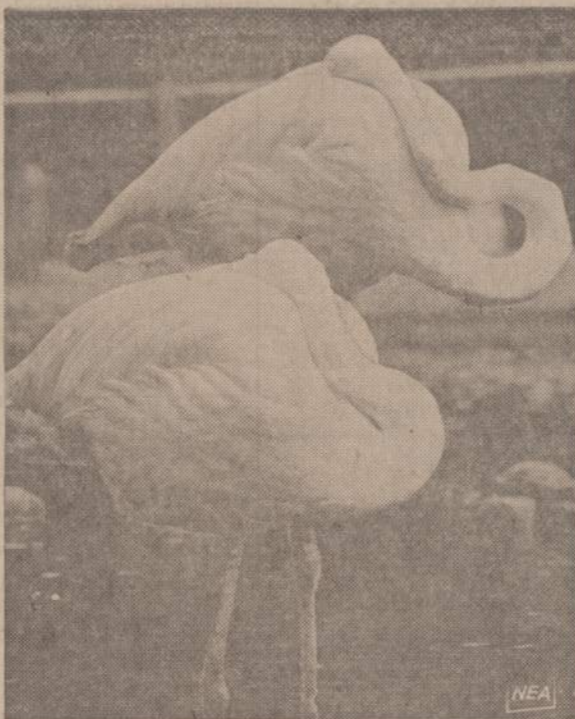
Flamingai miega ant vienos kojos, galvą iškėiči po sparnais. Pavėlė- le matome du flamingus, snūdurojančius Anglijos zoologijos sode.

vienai "karingai" juoduokį gau- jai East St. Louis mieste. DECATOR, Ill. — čia suimta 11 narių paauglių gauja, atsaka- kinga už visą eilę nusikaltimų, tokių kaip ginkluoti apilėšimai, užpuolimai, sumušimai ir pade- gimai.