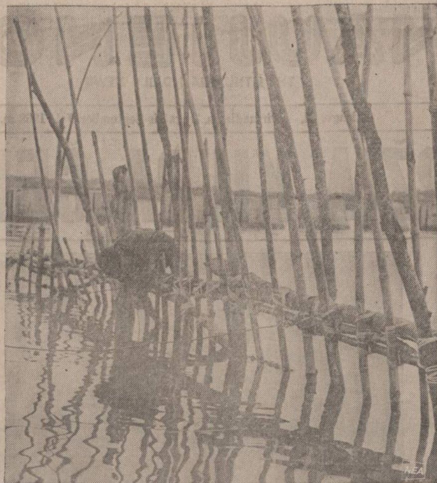
Thrieu Phong provincijoje, visai netoli Cam Lo upės užtvankos, žvejai stato užtvanką žuvims sulaukyti. Prie užtvankos jie tikisi pagauti daug žuvis.

SKAITYK "NAUJIENAS" - JOS TEIKIA GERIAUSIAS, TĖISTINGIAUSIAS ŽINIAS