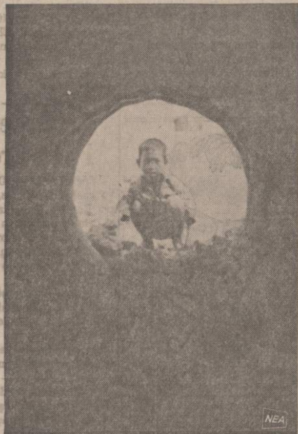
Pietu Vietname prie Cam Lo upės pastatyta užtvanka ir praversti vandens vamzdžiai greitai esantiems laukams drėkinti. Cam Lo srityje apsigyveno 13,000 tremtinių, pabėgusių nuo komunistų.

1739 So. Halsted St., Chicago 8, Ill. — Telef. HA 1-6100