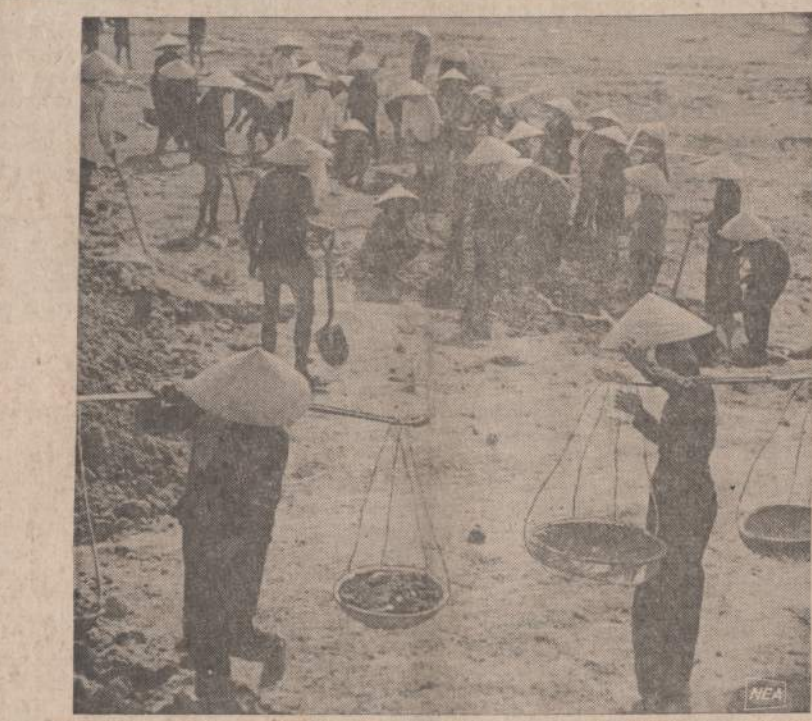
Pietų Vietname statoma nauja užtvanka Cam Lo upės vandenims užtvenkinti. Moterys padeda vyrams baigti užtvankos darbus. Iš šiaurės nuo komunistų pabėgę tremtiniai gaus drėgnos žemės, galės sodinti ryžius ir kitas daržoves.

ti grupė, kuri planavo nušauti dabartinį premjerą. Papadopoulos.