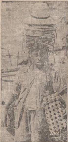
Paveiksle matomas berniukas Diamond Harbor, Ind., pardavinėja šiaudines pintines ir skrybėles.