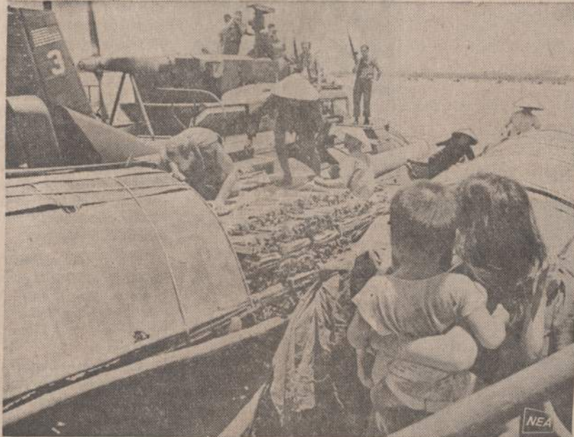
Pietų Vietnamo vandenys yra daug sampanų, kuriuos komunistai naudoja kariams ir karo medžiagai išmugeliuoti. Amerikos ir Vietnamo kariai tikrina Hue vandenys esančius sampanus.

Iš 210 žinomų ar įtariamų Mafijos narių, kurie buvo apkaltinti ar nuteisti per 13 metų, vie-nais tik praeitais metais buvo nuteisti 48.