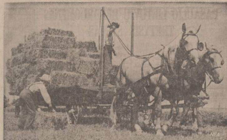
Wisconsin valstijoje, Belleville srityje yra didokas skaičius amių sektos fermerių. Paveiksli matome amišus, vežančius žioviną ir suraišiotą šieną.

Laisvame pasaulyje esantieji lietuviai turi griežčiausiai protestuoti prieš šitokią okupacinės sovietų valdžios elgesį. Rusai neturi jokios teisės naudoti pavergtos krašto jaunimą naujiems užkariavimams. Sovietų imperijos valdovai neturi teisės naudoti pavergtos Lietuvos jaunų vyrų kitoms tautoms pavergti.