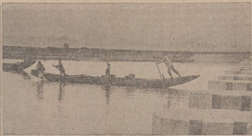
Pietu Vietname pastatyta nauja užtvanka. Prie statybos darbu dirba vyrai ir moterys. Apskaičiuota, kad Trieu Phong provincijoje apie 30,000 tremtinių gaus žviežio vandenį ir galės įsikurti. Užtvanka sudarys 250 akrų žemės ryžiams auginti.

Jokios revoliucijos tada jie Lietuvoje nesukėlė ir kelti nesiryžė, o tik parodė, kad užsienio lietuviams rūpi savo tėvų žemė ir kartu savo tautinė kultūra. To meto tas Pasaulio Lietuvių suvažiavimas sumetė gal-