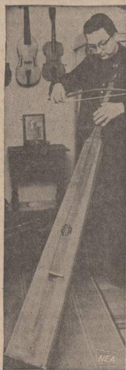
Paveiksle matomas smuikas buvo vartojamas 15-tame šimtmetyje. Tai yra vienas iš instrumentų, per stebuklą užsilikęs Vokietijoje. Smuiko savininkas bando ištraukti šio seno vienasystgio smuiko garsus.

PLB seimui taip pat būtinos kultūringos įvairios pramogos.