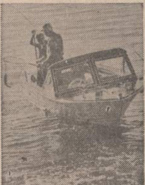
Kaip Kanadoje, taip JAV valstybėse žmonės mėgsta paplaukioti laivais ir pameškerti. Paveiksle matome amerikiečius, plaukiojančius Kanados vandenyse.