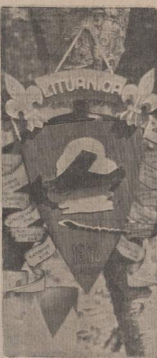
BROLIJOS MEDŽIO DETALĖ Chicago Lituanicos tuntu herbas ant Brolijos Medžio Penktoje Tautinėje stovykloje.