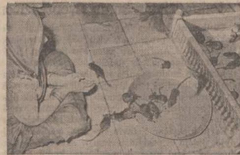
Indijoje, Dešnuh dykumoje yra maldykla, kurioje maitinamos dykumos pelės. Paveiksle matome tikinčią moterį, atnešusią maldyklon lėkštę blynų. Moteriškė meldžiasi, o pelės, kaip matome, blynus tuojau sudorojo.