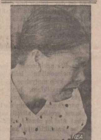
Komunistai užpuolė Tai Ninh kaimelį ir viską sudegino. Gyva likusi moteris verčia savo namo ir jame buvusio turto. Tūkstančiai Vietnamo moterų panašiai verčia.