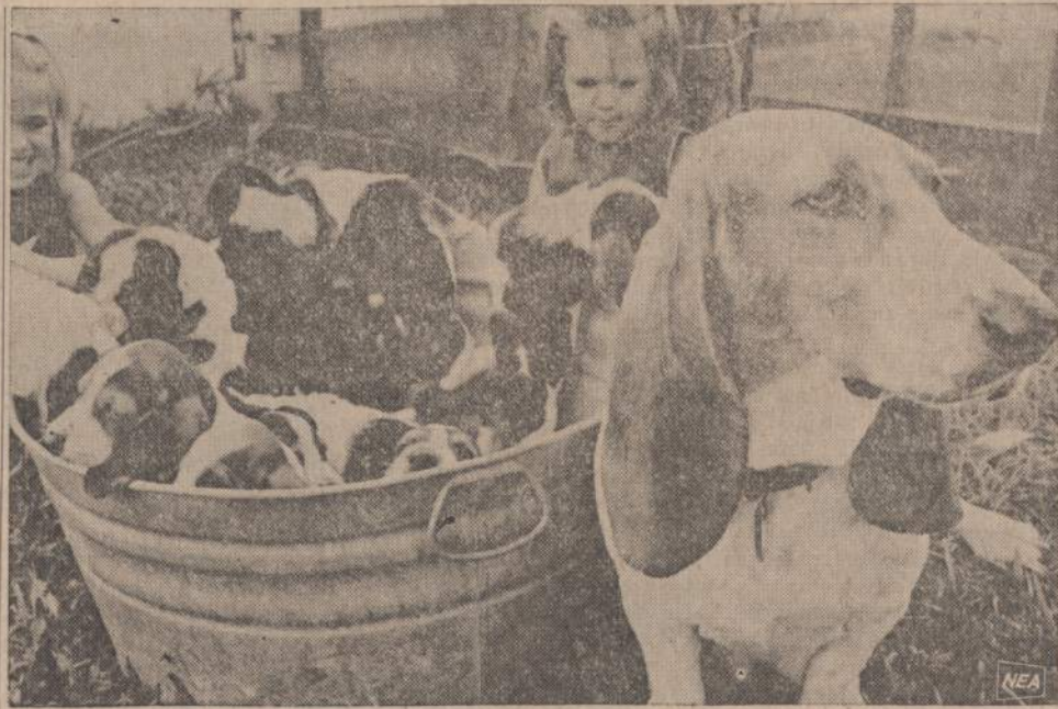
Viena St. Petersburg, Fla., kalė atsivedė net 10 šuniukų. Kelias savaites jie buvo laikomi balėjoje, bet jie jau pradeda nerimauti. Šuniukai nori išlipti ir žeme pabėgti. Mergaitėm patinka sekti besitrinančius šuniukus.