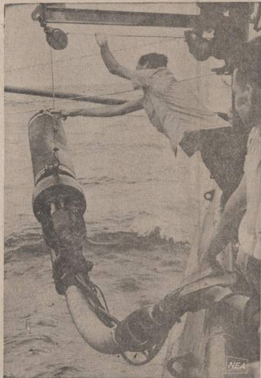
Leidžia į jūros dugną prietaisą, kuris praneša jūros dugno sudėtį. Dugne atsistojes prietaisas leidžia į visas puses radijo bangas, kurios atfoka ir atsimuša į laive esančią specialią anteną. Sugrįžusios bangos pasako, ar dugne yra granitas, molis, dumblias, geležis, aliejus ar kita medžiaga. Radijo bangos taip pat pasako, kokio storio jūros dugno klodai yra. Specialistai greičia jūros dugną toje vietoje, kur aliejaus versmė yra arčiausia.

NEW YORKAS. — McCall žurnalas nupirko sen. Roberto Kennedy rankraštį apie sovietų atominių sviedinių krizę Kuboje ir iš anksto sumokėjo milijoną dolerių. Tai būsimi svarbiausioji mūsų laikų knyga, pranešė McCall vyr. redaktorius Norman Cousins. Robert Kennedy prie savo brolio prezidento buvo generaliniu JAV prokuroru. Rankraštis pradėdamas spausdinti lapkričio mėnesio laidoje. Pajamos eina į Kennedžių giminės išdą.