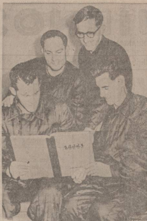
Šiaurės Korėjos nelaisvėje esantieji Amerikos iūreiviai pasisunkia giminiams ir pažįstamiems tokius grupių nuotraukas. Belaisviai rašo, kad jie turi progos pasimokyti.

Enciklopedija Britanica ir Americana jau 30 metų įkandžiai laikosi nusigyvenusio šifro, trys milijonai lietuvių! Amerikos Lietuvių Taryba pirmoji pasisakė, jog atstovaujanti milijonui Amerikos lietuvių. Na, tas milijoninis skaičius buvo užfiksuotas 1940 metais, o ALT juo dar vis vadovaujasi, nepaisant to, kad 28 metų eigoje Amerikoje vyko ir tebevyksta gyventojų