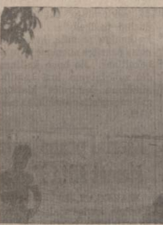
Clevelando jūrų skautai užsiėmimų metu, Superior ežero vandenyse.