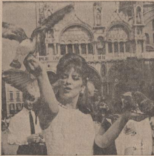
Venecijon nuvažiuosieji turistai stebisi aikštėse, paminkluose ir pastogėse esančia didele daugybe balandžių. Jie alkani ir prašyte prašyte įvairių riešutų. Venecijon nuvažiusi artistė Gina Lollobrigida negali praeiti alkanų balandžių nepamaitinusi.

Laisvieji lenkai visame pasaulyje giliai apgailestauja tragišką faktą, kad narsioji Lenkijos armija, pasižymėjusi heroiskais rezistencijos rekordais prieš bendrą vokiečių ir sovietų invaziją 1939 metais ir prieš sovietų armijos grėsmę 1956 metais, buvo dabartinio komunistinio Lenkijos re-