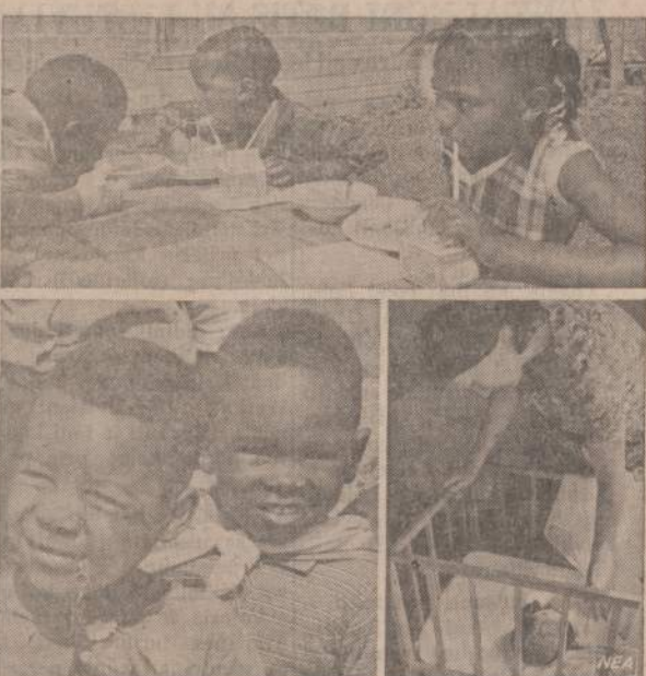
Dideliuose ūkiuose besikišiojantieji laukų darbininkai savo vaikus palieka prie namų, o patys dirba laukuose. Vyresnės amžiaus moterys paliekamos vaikų prižiūrėti.