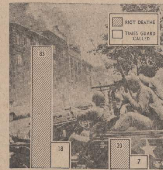
Šia vasarą dėl rasinių nesutarimų amerikiečiai žymiai mažiau maištavo, negu praeitais metais. 1967 metais riaušių metu gyvybės neteko 83 žmonės, o šiais metais tik 20. Praeitais metais karo jėgos teko siųsti į 18 vietų, o šią vasarą tik į septynias.

ninkų įjungimui į Lietuvos vadavimo veiklą;