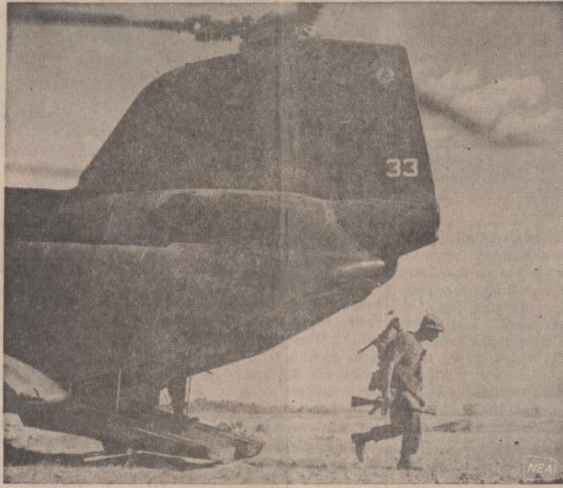
Amerikos karys Pietu Vietname lipa iš malūnsparnio, kad galėtų užimti priešakines pozicijas. Rugsėjo mėnesį Amerikos marinams pavyko išmušti komunistus iš pietinės demilitarizuotos dalies.

Walter Reuther Kalifornijoje sako kalbas darbininkams, patardamas balsuoti už H. H. Humphrey, nes jis visą laiką buvęs darbininkų draugas.