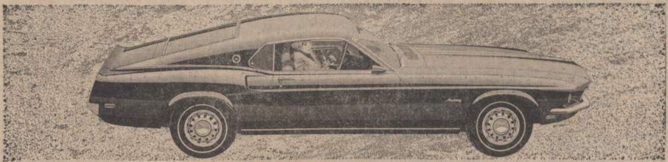
1969 Mustang SportsRoof

BIZNIERIAI, KURIE GARSINASI "NAUJIEŠOSE" — TURIGERIAUSIA PASISEKIMA BIZNYJE