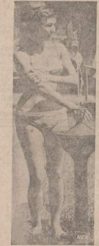
Gražiai nuagusi rumunė mergina vėsinasi Bukarešto parke prie geriamo vandens fontano.

REMKITE TUOS BIZNIERIUS. KURIE GARSINASI "NAUJIEŅOSE"