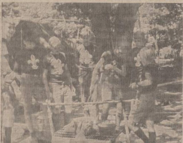
DIENA KARŠTA, BET UGNIS DAR KARŠTESNĖ...

Mes išsikasėme bunkerį — tokį pat, kaip lietuviai vartoja. Įėjau į bunkerį ir pamaciau lietuvišką vėliavą, kuri tikrai buvo naudota Lietuvos partizanų. Pagalvoju apie lietuvius vergijoje. Atrodė, kad aš tuoj galėčiau pasiimti šautuvą ir kartu su partizanais kovoti dėl Lietuvos.