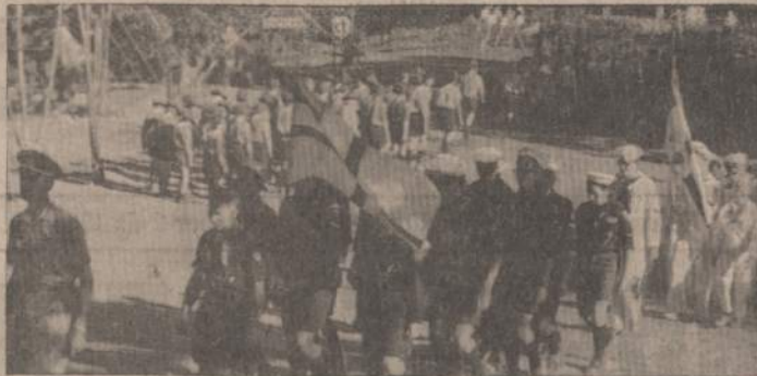
ISKARPA IŠ SUKAKTUVINĖS STOVYKLOS UZDARYMO

PIK. Juozo Šarausko draugovės skautai verda pietus Penktoje Tautinėje Stovykloje.