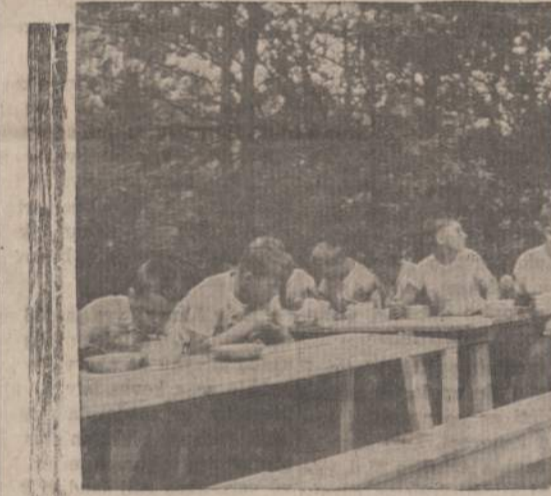
UZKANDIS PO DIENOS DARBŲ STOVYKLOJE