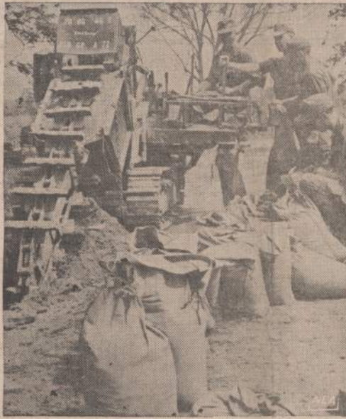
Amerikos kariai Vietname turi įvairių mašinų. Viena mašina jie kasa reikalingus griovius patrontėje ir prie kareivinių. Paaikėjo, kad tą pačią mašiną jie gali naudoti mašins žeme pripildyti. Mašiniai apsaugo apkausus, o miestuose namus. Keturi kariai į minutę mašina gali pripildyti 4 mašius smėlio.

Vokiečių pramonės gaminių užsakymai pakilo 20%. Užuot numatyto šiais metais bendro ekonominio produkcijos pakilimo 4%, kaip pranašauta metų pradžioje, dabar vyriausybė tikisi 5,5%.