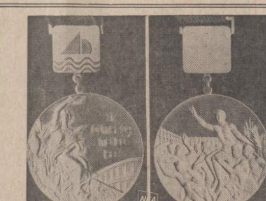
Meksikoje suruoštos Pasaulinės Olimpiados medalis. Vienoje pusėje ant rankų nešamas geriausias sportininkas, o kitoje pusėje olimpiados simbolis.