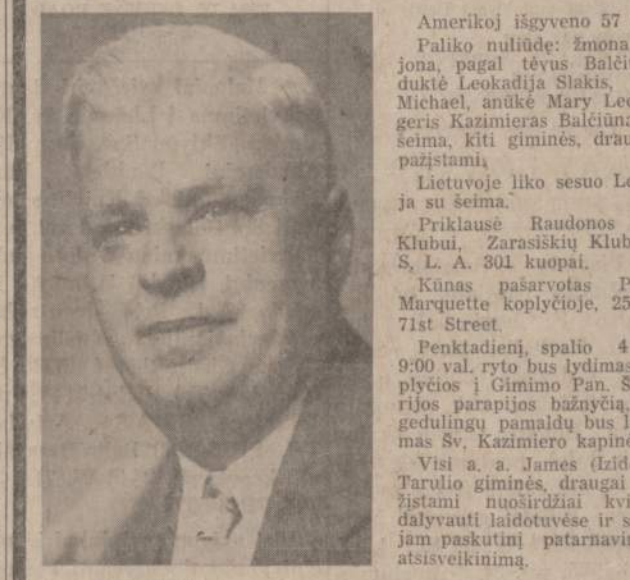
Nulūdė lieka: Žmona, duklė, žentas, anūklė, švogeris ir giminės. Laidotuvių Direktorai Petkus ir Sūnus. Tel. 476-2345.

Mirė 1968 m. rugsėjo 30 d., 9:30 val. vak., sulaukęs 77 metų am- žiaus. Gimęs Lietuvoje, Užeńskių kaime, Vajaiškio parap., Zarasų apskr.