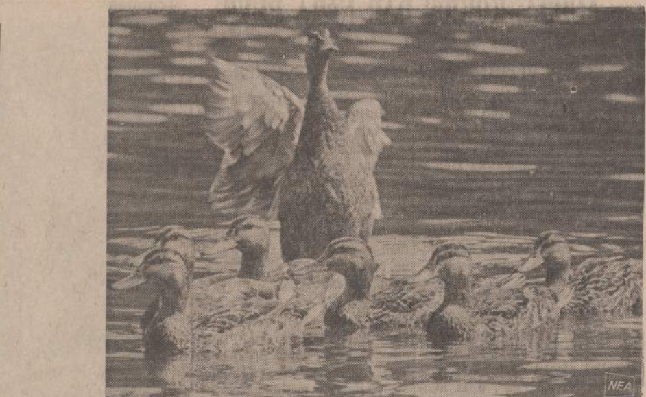
Antis, užauginusi ir per vasarą išaugojusi ančiukus, moko juos skristi. Jie turi pramokti, kaip plasnėti sparnais, o vėliau motina jiems parodys, kaip pakilti.

Kai demokratai yra tiek pakrikę, tai nieko stebėtino, kad vyrauja pesimistiškos nuotaikos, susijusios su demokratų šansais rinkimus laimėti. Tiesa, kai kurie prisimena 1948 m., kai taip pat vyravo pesimistiškos nuotaikos: tada buvo pranašaujama, kad Harry Trumanas rinkimų nelaimės. Pranašavimai neišsipildė ir Trumanas buvo išrinktas prezidentu. Panašiai gali atsitikti ir šiomet. Tačiau šansai, kad taip gali atsitikti, nėra labai palankūs. Bent tokia yra susidariusi nuomone.