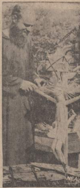
Milwaukee pranciškonas vienuolis nupynė šiaudinį kryžių ir Nukankintaji. Savo darbą jis nuvežė į Meksikos religinio meno parodą.

Katalikų savaitraštis The New World (NC) praneša iš Essen, Vokietijoje, kad tame mieste įvykusiame Vokietijos katalikų pasauliečių metiniame 20,000 dalyvių mitinge buvo suaruštos diskusijos popiežiaus enciklikos Humanae Vitae klausimu. Diskusijose dalyvavo 5,000