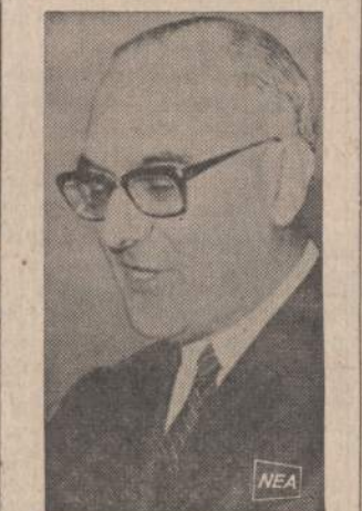
Naujas Portugalijos premjeras Marcelo Caetano. Diktatoriui Salazar atgavus samonę, prof. Caetano sudarė naują vyriausybę. Jis yra pasiūlyęs leisti veikti kitoms politinėms partijoms. Jis draus komunistinę veiklą.