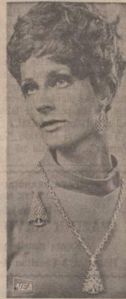
Jau gaminami Kalėdų papuošalai moterims. Be specialiai paruoštų brangenybių, rinkoje jau yra ir priderinti auskarai.

teorai per valandą, Meteoroų "lietus" būsiąs ankstybomis rytmečio valandomis.