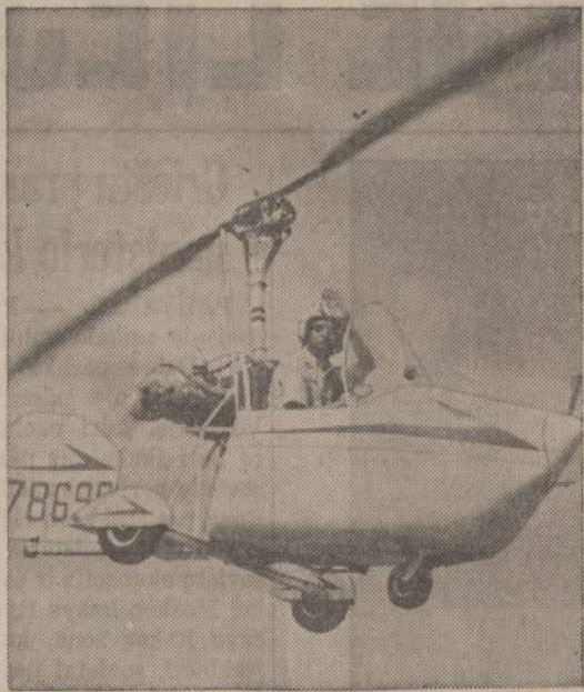
Kalifornijos jaunimas labai išradingas. Kiekviena metų pramonėje dirbantys jaunuoliai išgalvoja vis naujesnį sportą. Kairėje matome sklandytoją, naudojančią malūnsparnių propelerį. Sklandytovas turi mažą motoruką, kuris pamažu suka viršuje esantį malūnsparnių propelerį. Malūnsparnių motoras suka propelerį, o sklandytuve tik tai truputį pasuka.

Būkime vieningi • Balsuokime už respublikonus • Balsuokime už Lietuvius.