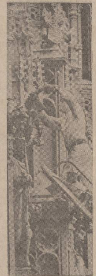
Lidazius britų parlamento rūmų, reikėjo juos apipurkšti chemikalais, kad atskirdė paukščiai jų neapretu. Paukščiai nemėgsta stiprių chemikalų.

Kol gyvi, jie kaip ir visi kiti, vaikiškioji žeme, naudojosi saule, oru ir vandeniui, ir šiek