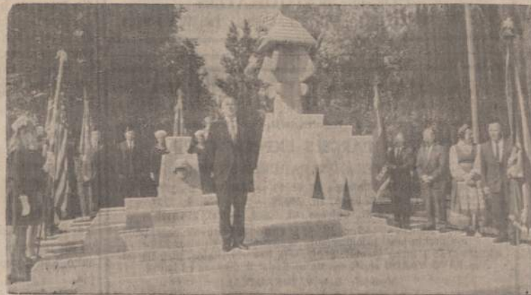
Pagarbiai lenkiasi vėlavos tyla ir maldai prisiminus žuvusius už Lietuvos laisvę Vilniaus Dievo minėjime Jaunimo Centro sodnyje šiais ypatingais laisvės kovos metais. Kalba kun. A. Trakis.

Amerikos ugniagesiai turi savo uniją — Firefighters Union. Unijos konstitucijoje buvo punktas, liečiąs streikų klausimą: no-strike clause. Tarptautinė ugniagesių unija tą punktą pašalino iš konstitucijos š. m. rugpjūčio mėnesi. Dabar, sekmadienį, spalio 6 d., tą klausimą balsavo Čikagos ugniagesių lokalis, kuriam priklauso per 4,000 narių. Ir jį kalbamą paragrafą pašalinė.