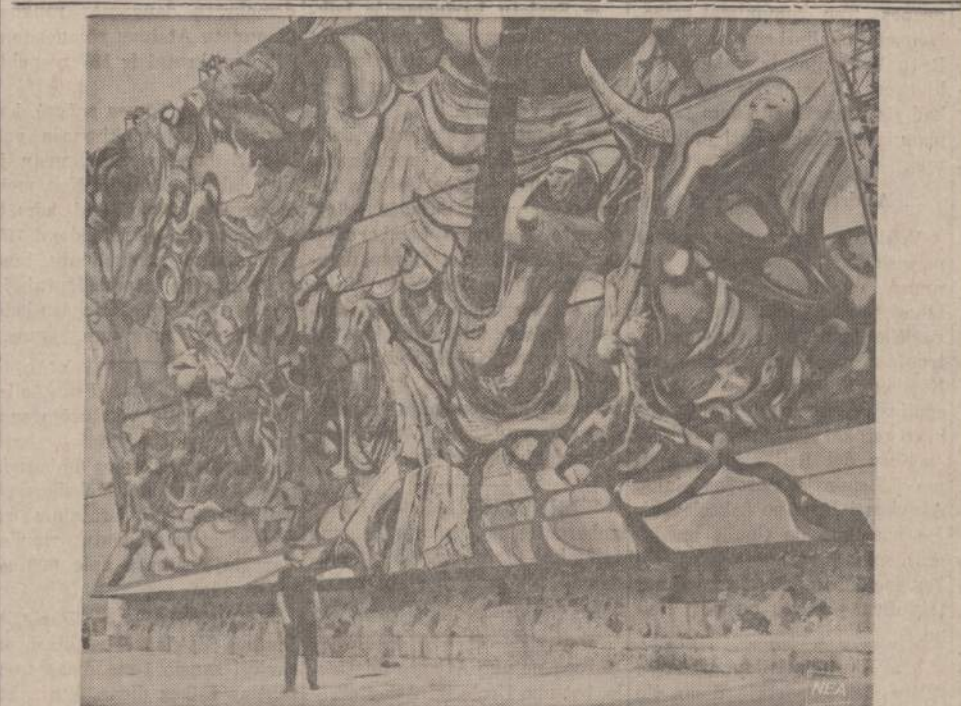
Meksikos menininkas David Alfaro Siqueiros pagamino 72,000 kvadratinų pėdų mūro pagrafinimą. Greta savo kūrybos stovi pats menininkas. Darbas vadinasi "Žmonių kelionė Pietų Amerikoje". Darbas bus atidengtas Meksikos Olimpiadų žaidimų proga.