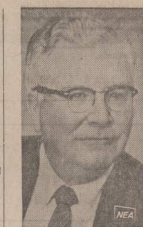
J. Russel Wiggins, "Washington Post" redaktorius, paskirtas JAV ambasadorium prie Jungtinių Tautų. Senato užsienio komitetui jis pareiškė, kad myli JAV ir yra pasiryžęs ginti valstybės institucijas ir užsienio politiką.

Paprastai dėl akmenų ar tulžies pūslės uždegimų prisieina tulžies pūslę operuoti. Ji visada pašalinama kartu su akmenimis. Žmogus turi kaip turėjęs tulžį. Net ir po tulžies pūslės operacijos nereikia žmogui savo valgio įpročių keisti, jei jie buvo žmoniški. Nereikia jokios spe-