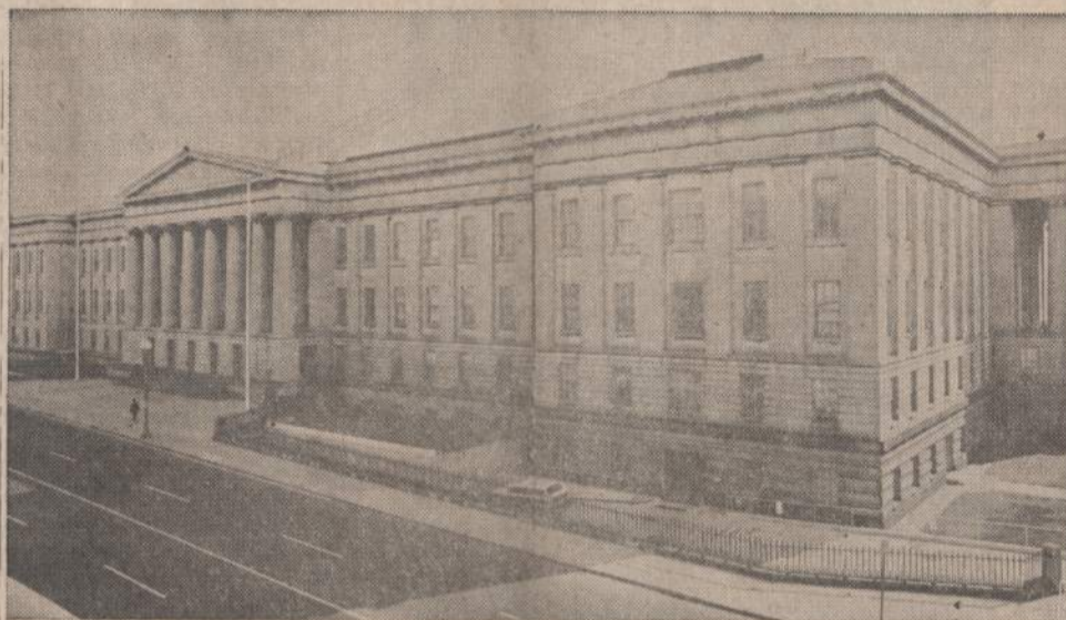
Visame pasaulyje išgarsėjęs Smithsonian Institutus Washingtono. Be pavyksų ir meno pavyzdžių, šiame muziejuje yra mokslo darbu. Institutus padeda pažinti Ameriką.