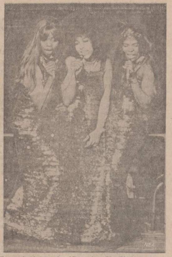
Viename Londono teatre vaidinama komedija "Plaukas". Paveiksle matomos trys moteriškos dėvėjos viena suknele. Žiūrovai plojo, kai dainininkėms ta suknelė nukrito.