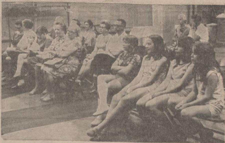
Alvudo Vaikų Teatro studija: tėveliai ir dalis vaikučių penktosios premjeros — Anatolijaus Kairo 3 v. vaidinimo "Du Broliai" skaitymo metu.

lą, tai tik mažesnės rūšies; toks ką nors apgautų mylimą gyvulėį pavogtų ar ką nors suklastotų. Švelnus, apvalus ir pasyvus jaunuolis irgi tyliau už pirmuosius du tipus reaguoja į žiaurias gyvenimo sąlygas. Tokius jaunuolius medicina vadiną endomorph'ais.