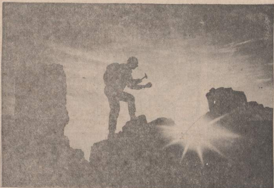
Kanados vyriausybė ir pramonininkai nori iširti, koki metalai ir mineralai guli pačioje šiaurėje. Specialistas tyrinėja Mackenzie upės šiaurėje esančioje saloje gulinčius mineralus. Kanadiečiams rūpi išaiškinti, ar šiaurėje yra uranijaus, vario ir sidabro.