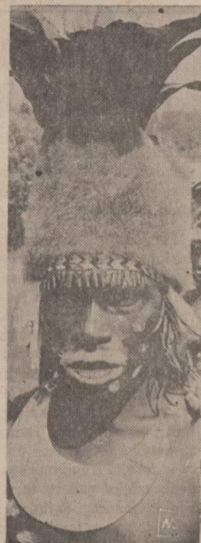
Naujos Ginejos baimė keliantis karą vadas. Ne vien jo kopurė, bet ir bal-tai dūžytos lūpos turi kelti baimę ke-lią pastojuantiems priešams.

Draugija prašo visuomenę remti jos darbą medžiaginiais, paskirus asmenis prašo tapti jos nariais. Draugijos adresas toks: Illinois Society for the Prevention of Blindness, 220 South State Street, Chicago, Illinois 60604; tel. 312 — WA 2 — 8710.