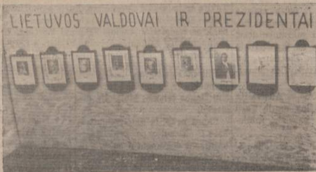
BROLIJOS KAMPĖLIS PENKTOJE TAUTINĖJE STOVYKLOJE

Istorinių uždavinių lenta pratybų slėnyje.