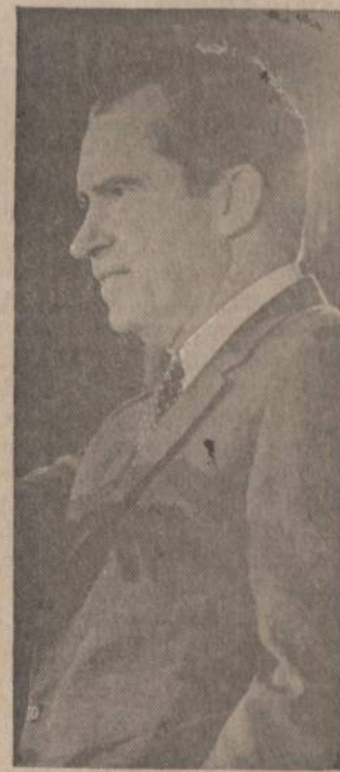
RICHARD M. NIXON

Balsavimo dieną, antradienį LAPKRIČIO MEN. 5 DIENĄ balsuok už RICHARD M. NIXON ir SPIRO T. AGNEW.